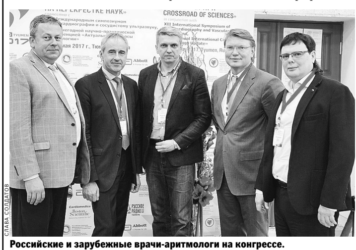
Российские и зарубежные врачи-аритмологи на конгрессе.

За три дня в работе конгресса приняли участие более 600 человек из 9 стран мира, в сборнике тезисов докладов опубликовано 228 научных работ, онлайн-трансляцию смотрели свыше 300 человек. В рамках форума были организованы XII Международный симпозиум по эхокардиографии и сосудистому ультразвуку, XXIV ежегодная научно-практическая конференция «Актуальные вопросы кардиологии», конкурс докладов молодых ученых, конкурс стендовых докладов, выставка медицинского оборудования и научной литературы. Конгресс аккредитован в системе непрерывного медицинского образования, участники получили 12 образовательных кредитов.