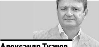
Александр Ткачев, министр сельского хозяйства РФ