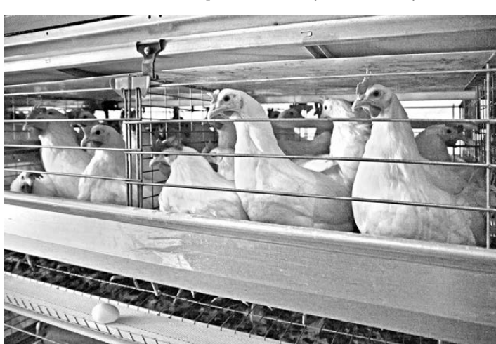
Результатом комплексной переработки отходов птицы должно стать органико-минеральное удобрение, на которое большой спрос.

Напомним, в начале апреля жителям поселка Красногорского из улицы Мира в поселке Красносельское местные власти запретили пользоваться водой из-под крана