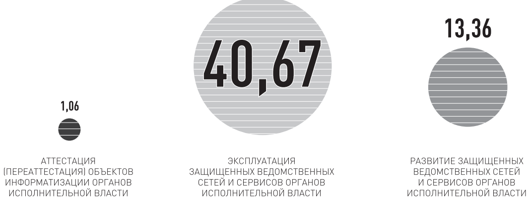
ИНФОГРАФИКА. РФ — ЕЛЕНА МАДЕР