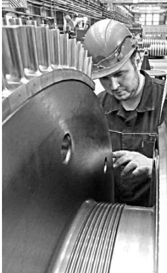
Екатеринбургский завод изготовил две паровые турбины для атомного ледокола «Арктика» и до 2018-го изготовит машины для ледоколов «Урал» и «Сибирь».

В Свердловской области уже реализуются эксклюзивные проекты изготовления оборудования, машин и материалов в северном исполнении