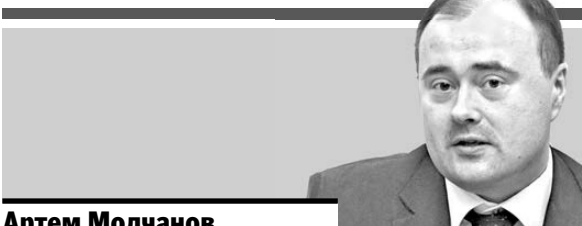
Артём Молчанов, начальник правового управления ФАС России