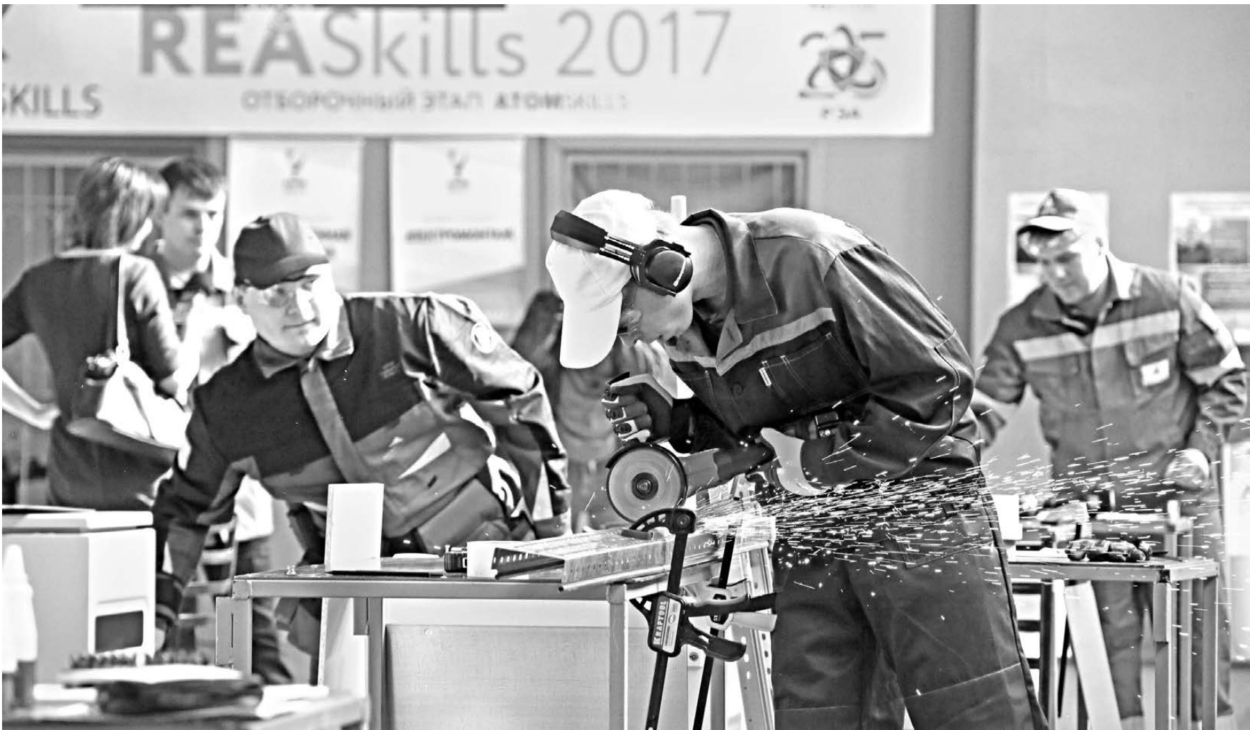
Представители 15 атомных станций со всей России приехали в Екатеринбург для участия в чемпионате профмастерства REASkills 2017. Соревнования одновременно проходят в разных регионах страны — по площадкам расположения атомных электростанций. Белоярская АЭС организует состязания по четырем направлениям: «Электроника», «Сетевое и системное администрирование», «Электромонтаж» и «Промышленная автоматика».