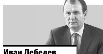
Иван Лебедев, заместитель министра сельского хозяйства РФ