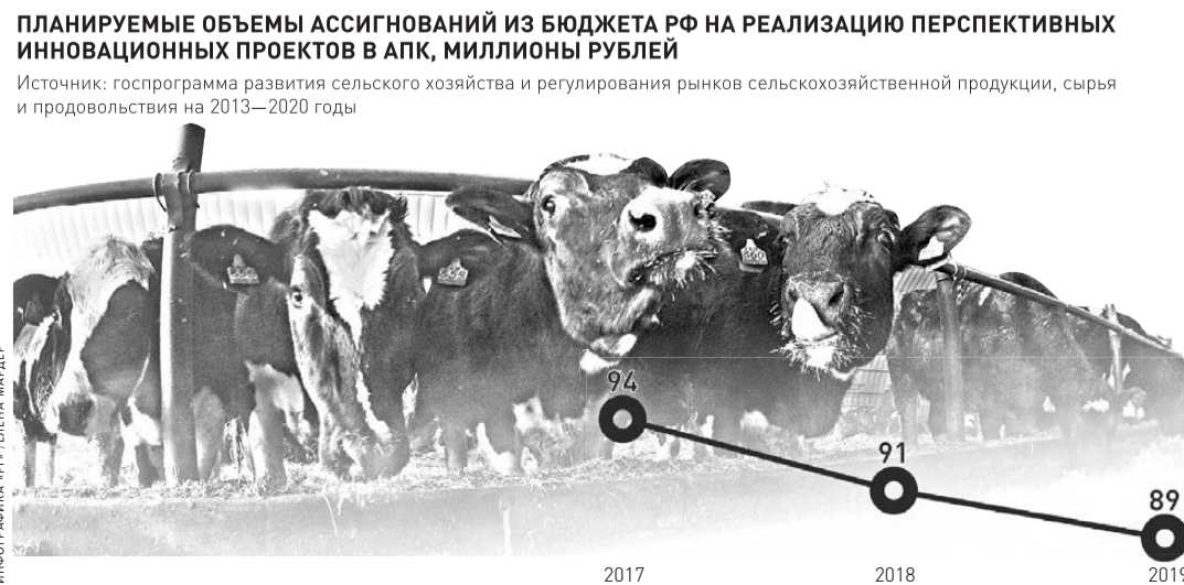
ИННОВАЦИОННЫЕ ПРОЕКТЫ В АПК, МИЛЛИОНОВ РУБЛЕЙ

Источник: госпрограмма развития сельского хозяйства и регулирования рынков сельскохозяйственной продукции, сырья и продовольствия на 2013–2020 годы