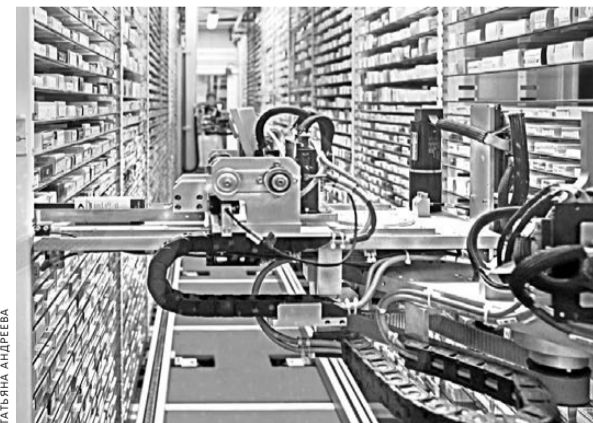
От того, по каким ценам закупает медикаменты областной склад, зависят и расценки в розничной аптечной сети.