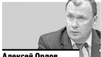
Алексей Орлов, первый вице-губернатор Свердловской области