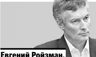
Евгений Ройзман, глава Екатеринбурга