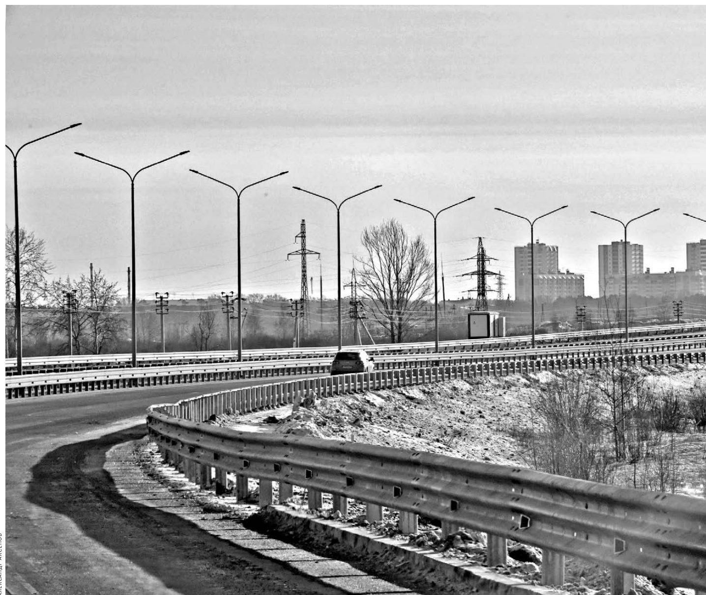
В Тюмени открыли новый участок кольцевой автодороги — между улицами Дамбовской и Тополиной. Строительство второго пускового комплекса Восточного обхода Тюмени началось 1 января 2016 года, дорожники сдали объект на месяц раньше срока. Таким образом, общая протяженность участка непрерывного движения на объездной дороге увеличилась на 3,5 километра и составила почти 35 километров.

Свердловские власти заявили, что намерены взять под контроль ситуацию на вентиляторном заводе в Артемовском. В ближайшее время придет ряд вступив с собственниками и работниками предприятия. По договоренности со службой судебных приставов арестовать имущество и претворить в работу завода никто не будет до окончательного правового разрешения спора.