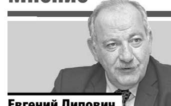
Евгений Липович, заместитель главы администрации Екатеринбурга