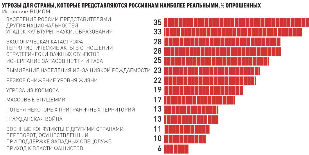
ИНФОГРАФИКА: РГ. — ЕЛЕНА МАРЧЕР

ЕКАТЕРИНБУРГ: ул. Тургенева, 13, офис 101. Телефон/факс (343) 371-24-84. E-mail: san@reg-ural.ru ТЮМЕНЬ: ул. Осипенко, 81, офис 1004. Телефон/факс (3452) 75-20-79, 75-20-86. E-mail: man72t@mail.ru ХАНТЫ-МАНСКИЙСК: ул. Комсомольская, 31, офис 209. Телефон (3467) 320-969. E-mail: bva62@mail.ru ЧЕЛЯБИНСК: Свердловский пр. 60. Телефон/факс (351) 727-73-33, 727-78-08. E-mail: chel@rg.ru