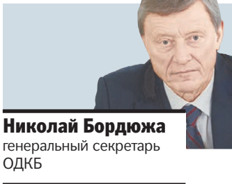
Николай Бордюжа генеральный секретарь ОДКБ

ПОЧТИ 3,5 миллиарда рублей потрачено за три года на реализацию программы развития физической культуры и спорта в Екатеринбурге, в том числе 759,7 миллиона из бюджета города. 868 миллионов — Свердловской области, 649,1 миллиона — из бюджета РФ, 1,2 миллиарда — из внебюджетных источников. Общее число спортивных сооружений за 2011—2013 годы выросло на 122 единицы и составило 1916 объектов. В результате количество горожан, систематически занимающихся спортом, в Екатеринбурге выросло до 28 процентов.