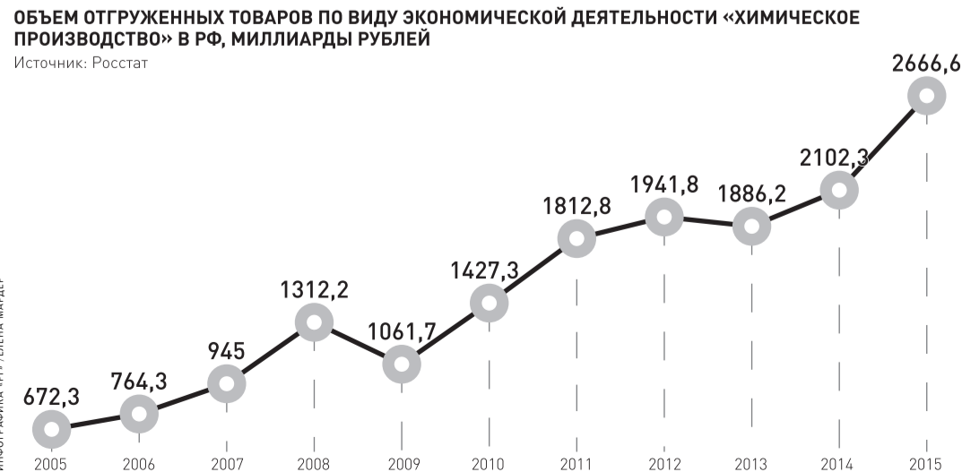
ИНФОРМАЦИЯ: ФГ «ЦЕНТРАЛЬНЫЙ СТАТИСТИЧЕСКИЙ ЦЕНТР»

ЕКАТЕРИНБУРГ: ул. Тургенева, 13, офис 820. Телефон/факс (343) 371-24-84, 355-30-68. E-mail: san@rg-ural.ru ТЮМЕНЬ: ул. Осипенко, 81, офис 1004. Телефон/факс: (3452) 75-20-79, 75-20-86. E-mail: man72@mail.ru ЧЕЛЯБИНСК: Свердловский пр., 60. Телефон/факс: (351) 721-73-33, 727-78-08. E-mail: chel@rg.ru