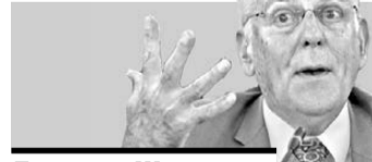
Данисель Шехтман, лауреат Нобелевской премии-2011 (Израиль)