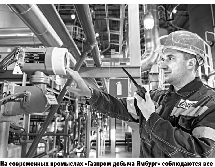
На современном промысле «Газпром добыча Ямбург» соблюдаются все требования по безопасности труда.