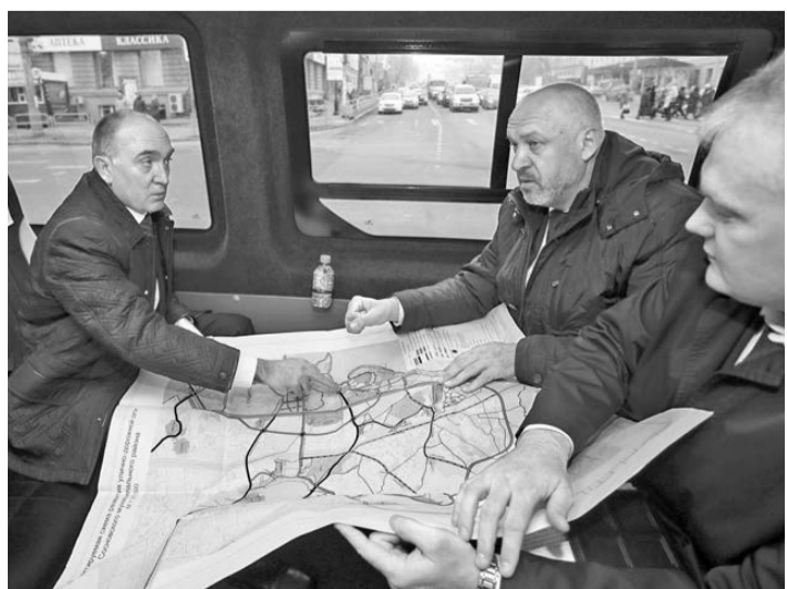
Губернатор Челябинской области Борис Дубровский (слева) уверен: областные и муниципальные власти должны совместно комплексно решить вопрос создания инфраструктуры в новых районах Челябинска.

— В прошлом году на строительство, ремонт и обслуживание автодорог регионального значения мы потратили 8,6 миллиарда рублей, ныне в дорожный фонд поступило более 11 миллиардов. Дополнительные ресурсы в дорожную сферу также направляются в рамках областной программы «Реальные дела», в первую очередь они идут на решение наиболее острых проблем в муниципалитетах. Очень важно, чтобы люди уже сейчас почувствовали улучшения.