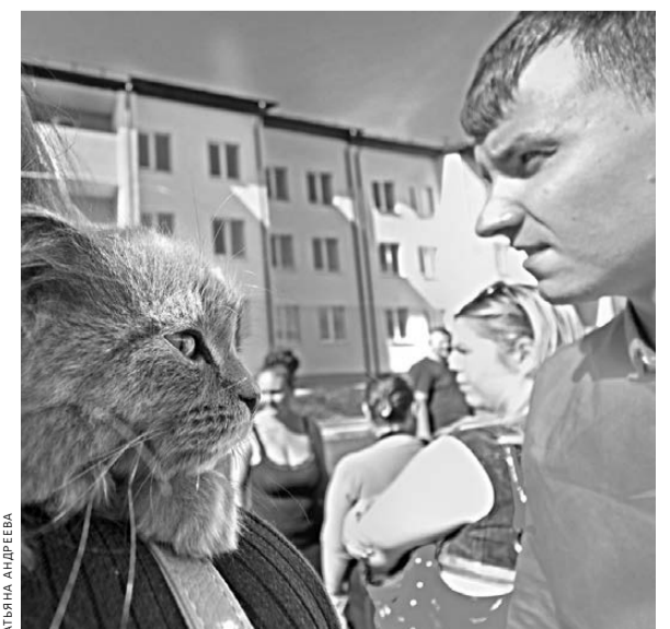
В Северном Урале на прошлой неделе сдали новый дом, в который заселились бывшие обитатели ветхого жилья.