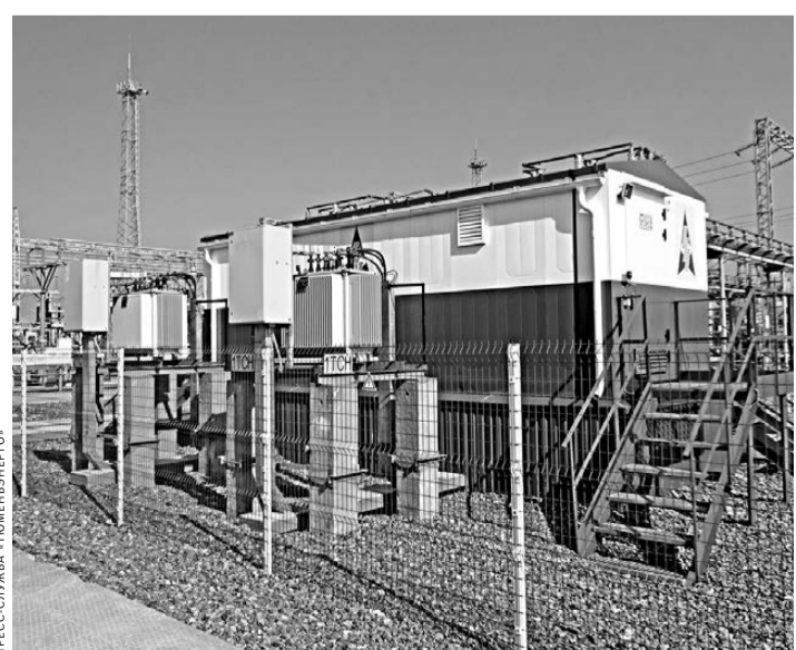
Новая подстанция «Соровская» обеспечит надежное энергоснабжение потребителей, в том числе нефтедобывающих компаний.

Один из таких проектов реализует нефтяной филиал «Тюменьэнерго», построив подстанцию 110 кВ «Чупальская» и «Соровская» с воздушными линиями 110 кВ. Среди потребителей, подконтрольных к сетям в 2016 году, — подразделение компании Роснефть. В нефтегазовом районе Югры ее объекты были присоединены к «Чупальской». В Когалымском районе энергетик обеспечил набор дополнительной нагрузки и технологическое присоединение к сетям электроэнергетики по проектной схеме ВЛ 110 кВ Кирилловская-Таврическая предприятиями нефтедобычи, принадлежащим компании «ЛУКОЙЛ-Западная Сибирь». Наступающую зиму они встретят без опасений.