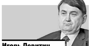
Игорь Левитин помощник президента РФ: