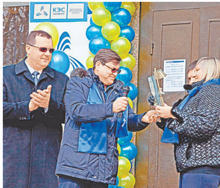
Открытие клиентского центра сделает процесс взаимодействия потребителей с поставщиком тепла максимально удобным.

Отметим, что в последние годы платежная дисциплина потребителей Свердловской теплоэнергетики компании в Екатеринбурге улучшилась: 86 процентов счетов за тепло и горячую воду стабильно оплачиваются в срок. Среди основных должников — лишь три управляющие компании. Но их суммарный долг превышает 500 миллионов рублей.