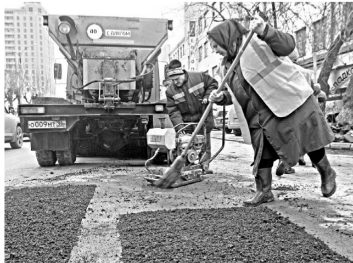
В этом году власти Екатеринбурга приняли беспрецедентное решение: ямочный ремонт начнется почти на месяц раньше обычного срока.

— Это лишь вопрос денег. В зависимости от суммы можно рекомендовать тот или иной материал. Но из администрации Екатеринбурга никто к нам за советом или консультацией не обращался, — сообщили в институте.