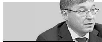
Владимир Якушев губернатор Тюменской области