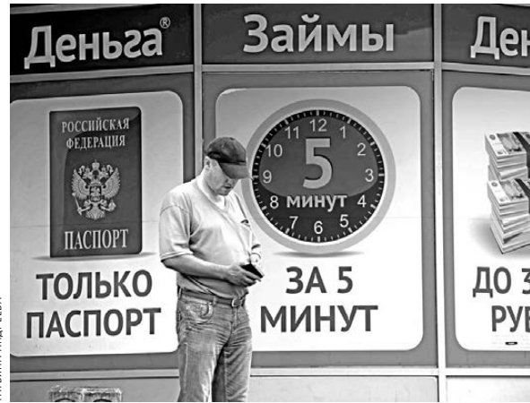
Попав в долговую кабалу проще простого, а вот выбраться из нее многие потом не в состоянии.

Внести поправки в федеральное законодательство и закрыть пункты выдачи микрозаймов ранее также предлагали свердловские парламентарии. Необходимость запрета «быстрых денег» они связывают, кроме прочего, с ростом числа suicides из-за казальных долгов. Так, один из жителей Асиеста в этом году покончил с собой после того, как взял под огромным процент кредит на восстановление разбитого автомобиля, но не смог рассчитаться. Членские депутаты, в свою очередь, недавно предложили запретить выдачу микрозаймов физическим лицам. Соответствующий документ был внесен на рассмотрение в Госдуму 6 мая.