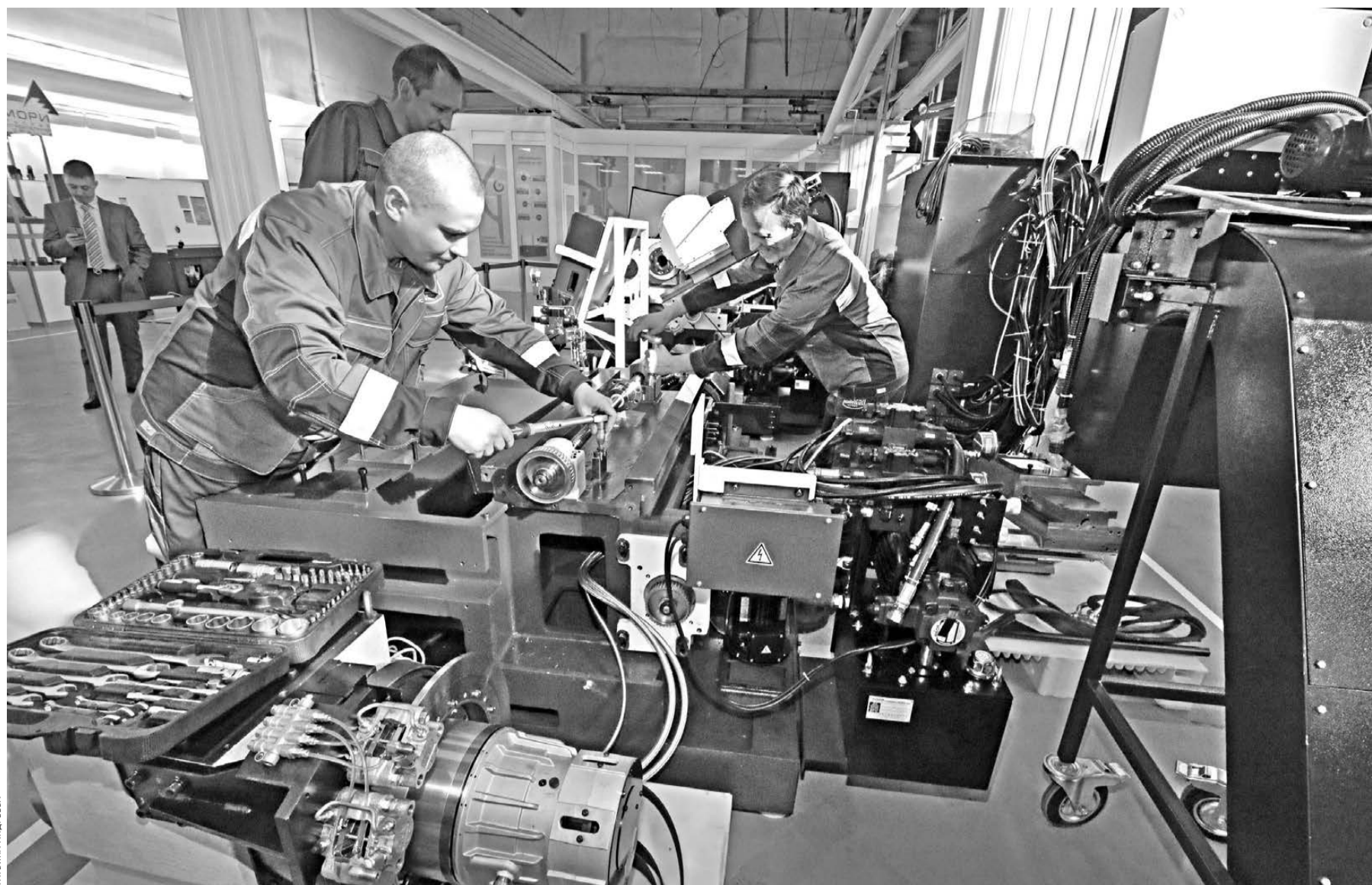
В Екатеринбурге запущено серийное производство новейших токарных станков с числовым программным управлением. Совместное предприятие появилось в результате договоренностей, достигнутых в ходе визита уральской делегации в Японию. Оборудование будет выпускаться в кооперации с рядом предприятий региона, которые изготавливают для данных станков трансформаторное оборудование, транспортеры и баки для стружки. Сейчас уровень локализации составляет 30 процентов, а к 2018 году достигнет 70-ти. Всего на новом производстве планируется выпускать до 120 станков ежегодно.

Отметим, что в 2013 году сельхозпредприятиям было перечислено из бюджета за лизинг около 17 миллионов рублей, в 2014-м — 24, а в 2015-м — почти 34 миллиона. В прошлом году хозяйства Курганской области закупили сельхозтехники на общую сумму свыше миллиарда рублей, в том числе 79 зерноуборочных комбайнов и 65 тракторов.