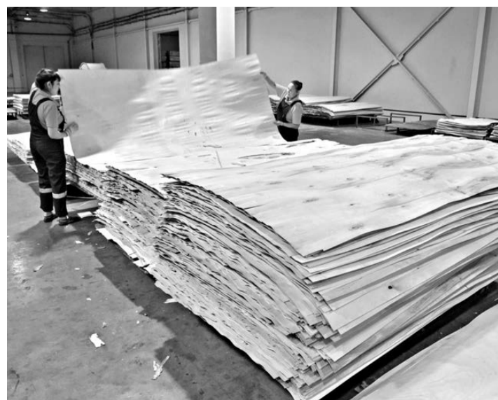
Переработка древесины, в том числе производство фанеры, — одно из перспективных направлений развития бизнеса в Тюменской области.

В перспективе индустриальные парки также могут появиться в Ялуторовске, Заводоуковске, Ишиме, Тобольске. В первых трех, как считают власти, на площадках можно завестись переработчиков сельхозпродукции, поскольку это довольно сильные аграрные территории. В Тобольске же логично собрать предприятия, занимающиеся переработкой полипропилена, поскольку здесь функционирует крупнейшее в мире производство полимера.