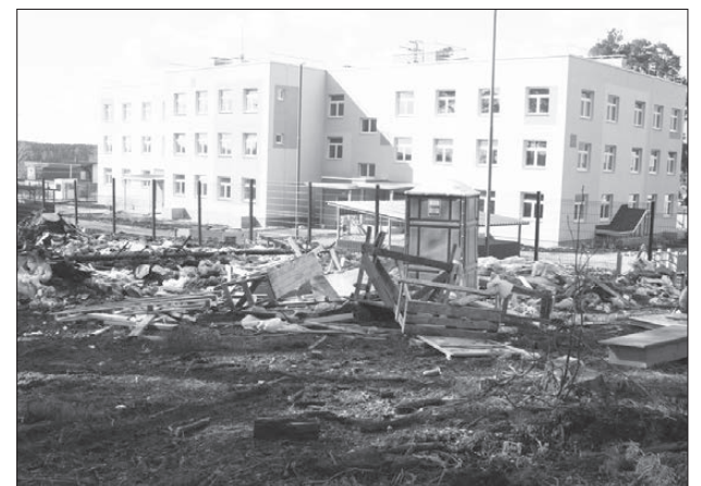
Детский сад в Октябрьском.

школьных учреждений, в том числе и вновь построенных дошкольных учреждений, пройдет в 3 декаде мая согласно Постановления Администрации Сысертского городского округа от 06.05.2015 г. № 1282 «Об утверждении Положения о порядке комплектования муниципальных казенных (автономных, бюджетных) дошкольных образовательных учреждений Сысертского городского округа, реализующих основную общеобразовательную программу дошкольного образования».