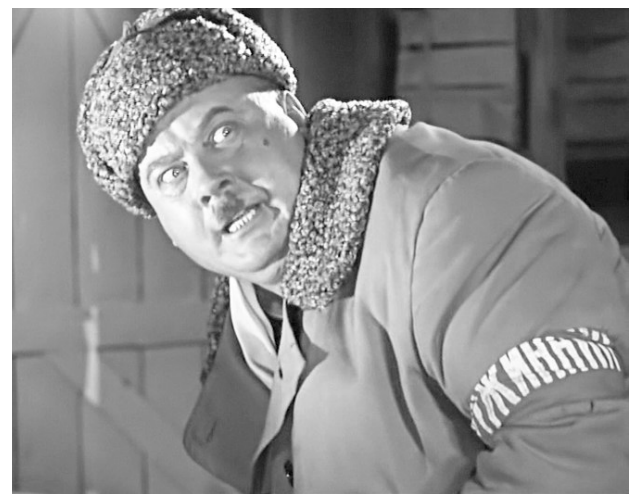
Кадр из фильма «Операция «Ы» и другие приключения Шурика»

Хотя план по набору дружинников Сысертский ГО перевыполнил, от желающих посвятить свое свободное время этой работе не отказываются и просят обращаться в администрацию округа. Главное условие – отсутствие проблем с законом.