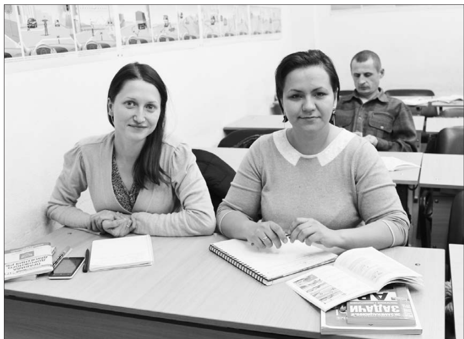
Возможно, этим милым курсанткам из автошколы «Экстра-плюс» придется сдавать экзамены по-новому