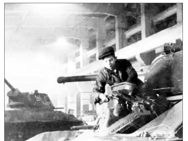
Идет сборка танка Т-34