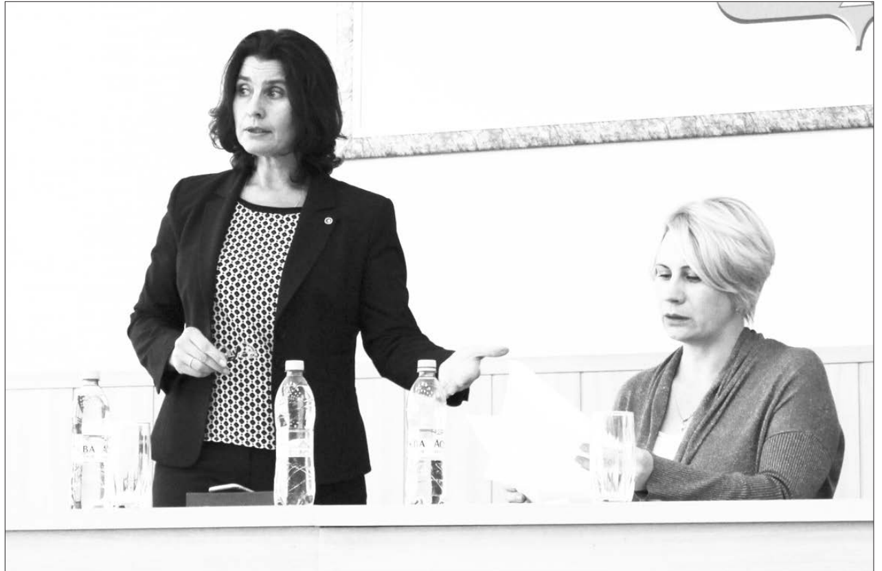
«...Мы, предприниматели, знаем, что кроме тебя самого никто не сделает...»

много вопросов, которые могут быть решены по максимуму «нет» или по максимуму «да». Или максимально запретить или максимально разрешить. И вот внутри этой вилки, на мой взгляд, и лежит понятие предпринимательского климата. Если муниципальные власти настроены на то, чтобы в условиях возможного выбора принять решение «да, разрешить, продлить», то это хороший предпринимательский климат. Тогда люди остаются здесь работать, создают рабочие места, формируют бюджет. Если же муниципалитет стремится в пределах этой вилки в сторону запрета, расторжения и так далее, то здесь, наверное, можно говорить о плохом предпринимательском климате и недостаточном понимании того, как он должен развиваться. Как раз в этом поле и нужно продолжать диалог. Один из инструментов нормального взаимодействия, выстраивания отношений – это встречи. Я полагаю, что они должны происходить чаще. Чтобы какие-