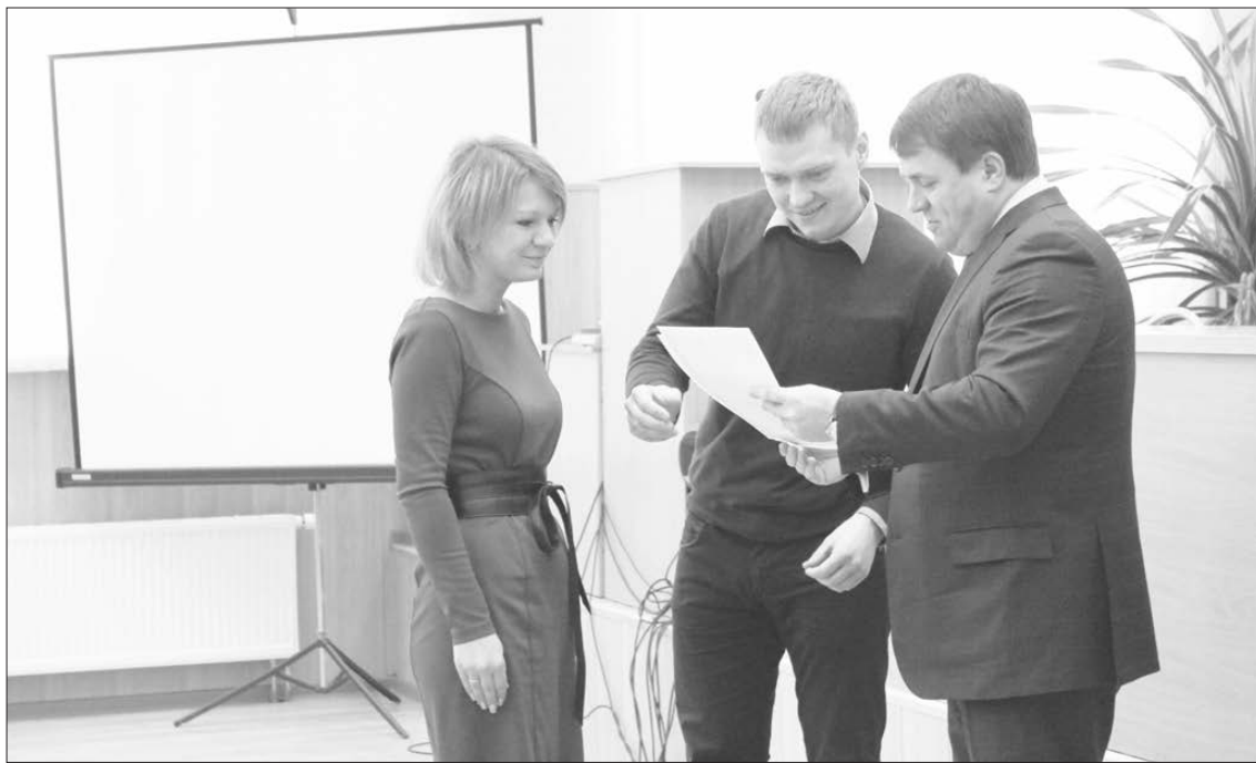
Вручение сертификата на социальную выплату молодой семье в 2013 году

ской области до 2020 года». Подпрограмма «Стимулирование развития жилищного строительства».