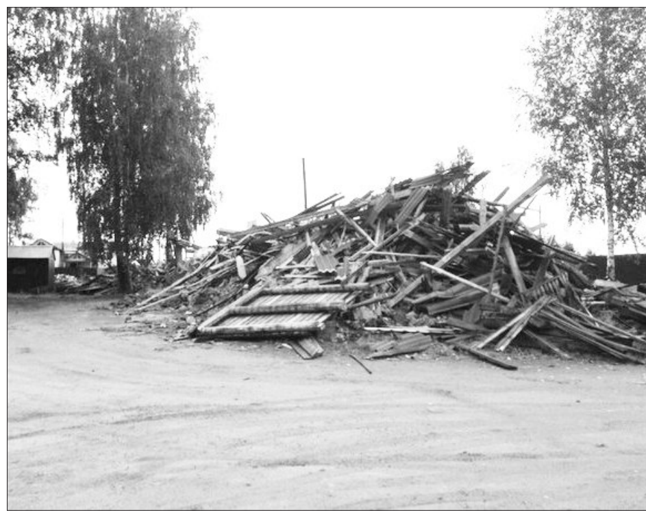
Кафе-музей разрушили за несколько часов