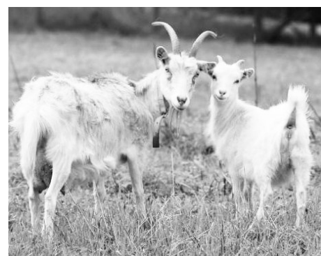
Бывали случаи заражения клещевым энцефалитом через козье молоко.