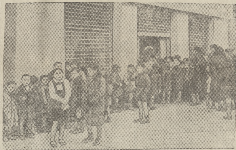
В ожидании очередного пайка в Испании.

Следовательно, опасность для России является нашей опасностью и опасностью США, также, как дело каждого русского, борющегося за свою землю и дом, является делом свободных людей и свободных народов в любой части земного шара. (ТАСС).