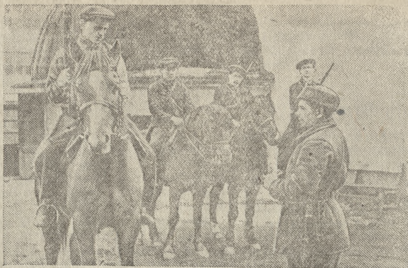
Кавалерийская школа при Облсоеввахиме готовит без отрыва от производства из рабочих, а также учащейся молодежи Ворошиловских всадников.

На снимке: учащиеся отличники школы получают задание по учебной разведке.