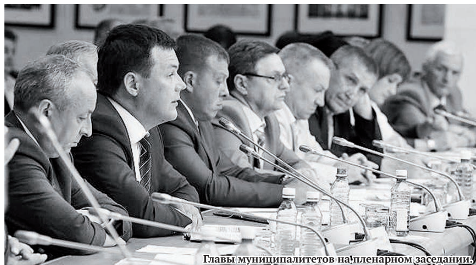
Главы муниципалитетов на пленарном заседании.