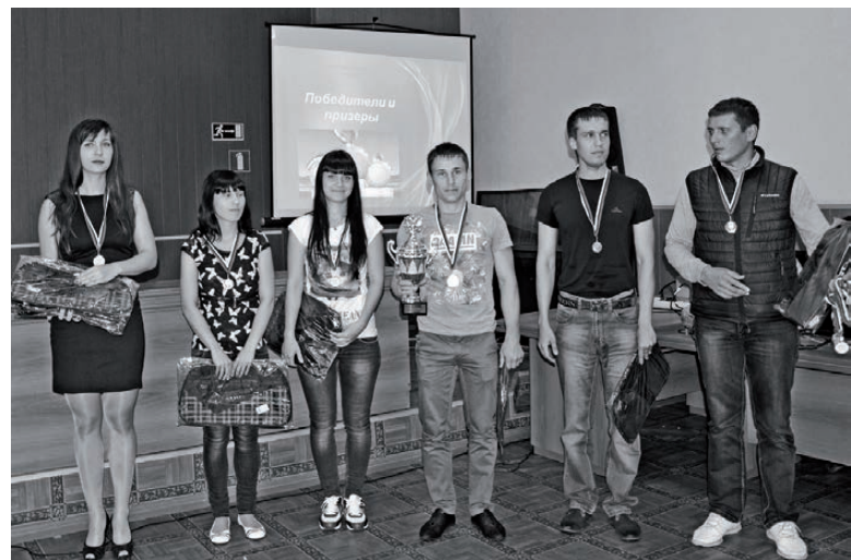
«Прометей» – победитель Спартакиады.