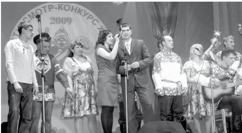
Выступают сотрудники СПЧ-4.

Зал полон. В воздухе витают волнение и торжественность. Всё внимание компетентного жюри и зрителей приковано к сцене. Главные действующие лица на ней – не профессиональные актёры, а армия огнеборцев. Да, оригинальности им не занимать! Не было такого жанра, в котором не попробовали себя наши пожарные. Стихи пишут, басни читают, исполняют танцы от вальса до канкана, играют хоть на баяне, хоть на гитаре, хоть... на стиральной доске, спеть частушки, куплеты и серьёзные произведения – да запросто! И даже