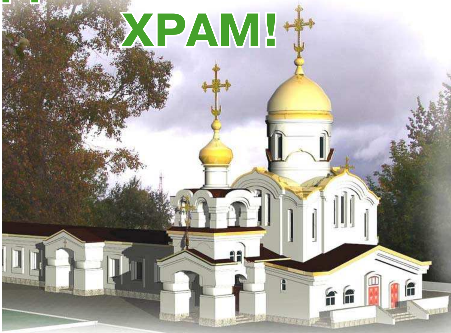
Эскиз будущего храма.

Очередное совещание попечительского совета по строительству храма в нашем городе было посвящено отчёту о проделанной работе, о собранных за этот период средствах, а главное – дальнейшим работам, которые начнутся в ближайшее время.