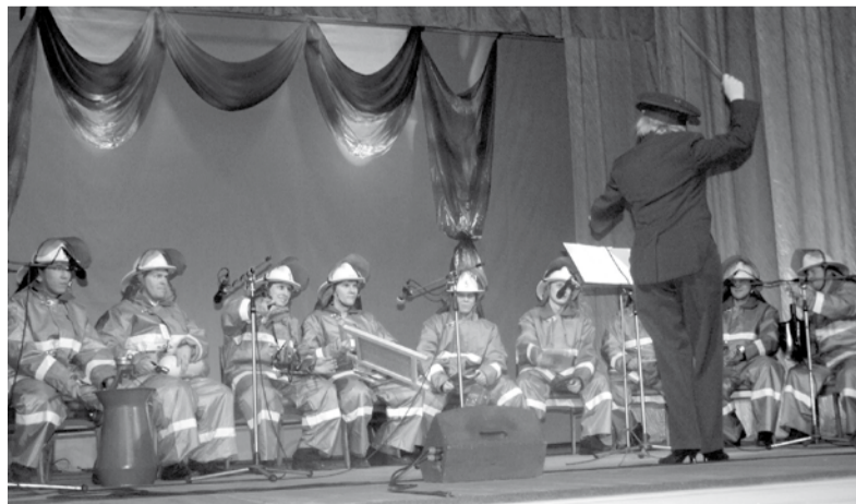
Под звуки пожинвентаря.