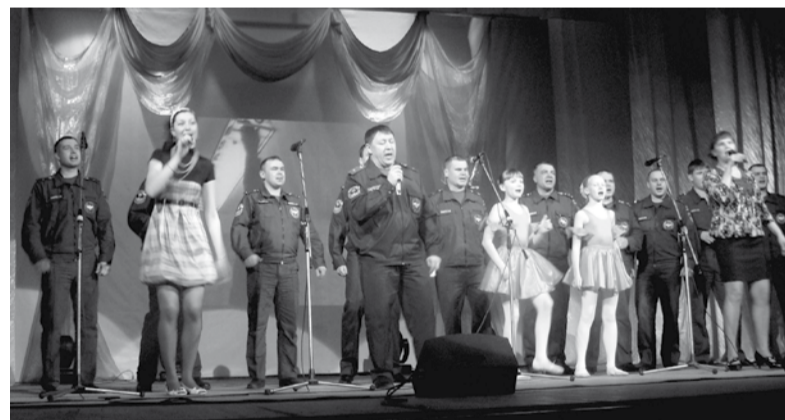
Победители - СПЧ-7.

ждого подразделения была какая-то своя особая нотка. Сотрудники СПЧ-4 очаровали своей душевностью, СПЧ-3 – задействовали почти всех сотрудников, СПЧ-1 – порадовали песенными дуэтами, СПЧ-2 – удивили непосредственностью, СПЧ-5 – время повернули вспять, представив пионерский хор, СПЧ-7