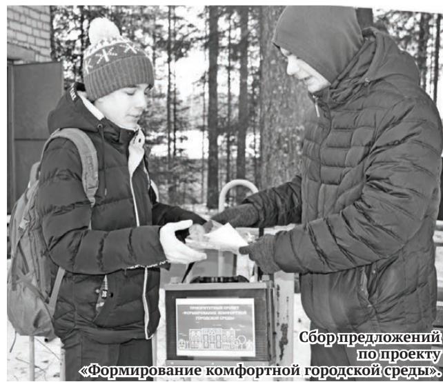
Сбор предложений по проекту «Формирование комфортной городской среды».

Отдел по физической культуре, спорту, молодёжной и социальной политике администрации ГО «Город Лесной» благодарит всех организаторов, судейскую бригаду, спонсоров и партнёров гонки «Лыжня России» (ПАО «УралТрансБанк», страховая медицинская компания «Астрамед-МС», БИНБАНК и магазин «Чемпион»), а также всех участников гонки! До новых встреч на соревнованиях!