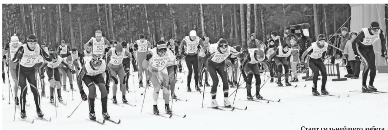
Старт сильнейшего забега.