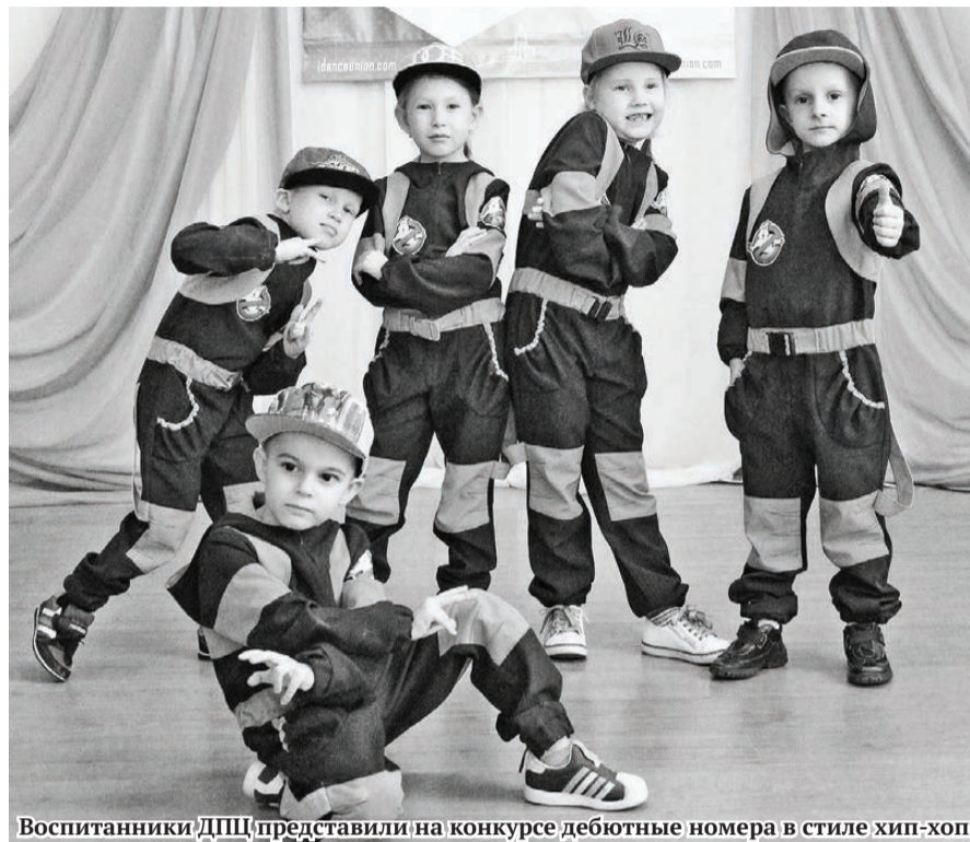
Воспитанники ДТЦ представили на конкурсе дебютные номера в стиле хип-хоп.