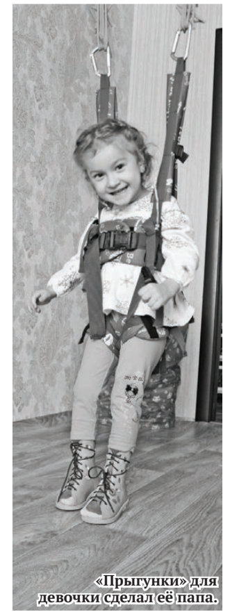
«Прыгунки» для девочки сделал её папа.