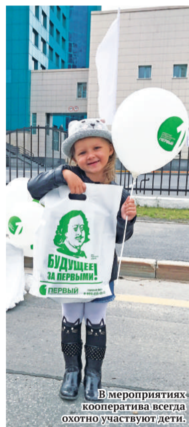
В мероприятиях кооператива всегда охотно участвуют дети.

– Конечно. Мы продолжаем оказывать помощь детским социальным учреждениям в Лесном, Нижней Туре, посёлке Лосином, ветеранским организациям, поддерживаем спортивные объединения. Кроме того, стараемся откликаться на просьбу городских властей финансово участвовать в проведении различных праздников и мероприятий социальной направленности в городах при-