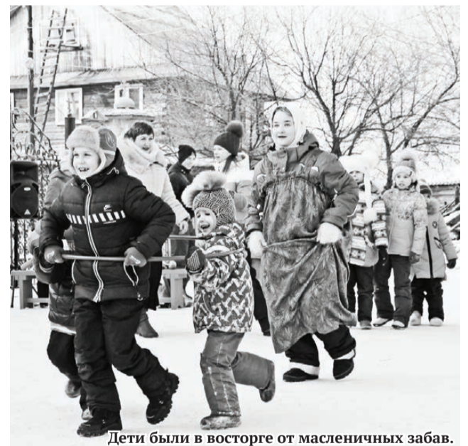
Дети были в восторге от масленичных забав.