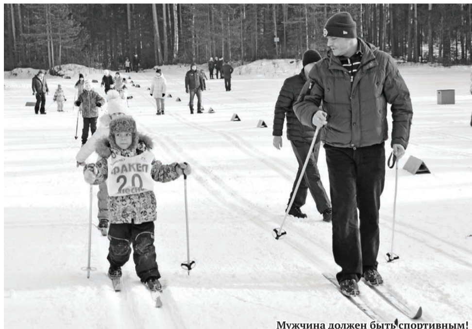
Мужчина должен быть спортивным!