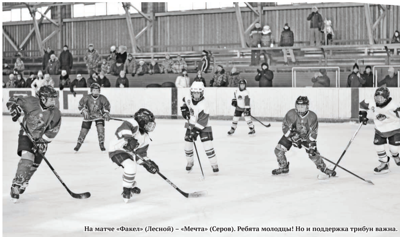
На матче «Факел» (Лесной) – «Мечта» (Серов). Ребята молодцы! Но и поддержка трибун важна.

командой «Металлург», 18 февраля – ответная игра на хоккейном корте «СДЮСШОР «Факел». Ждём болельщиков для поддержки ребят в главном матче этого спортивного сезона!