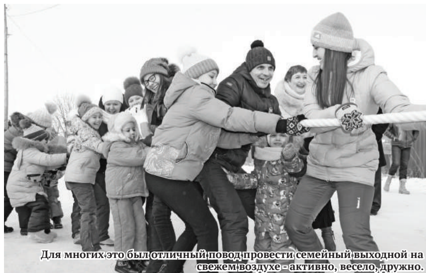
Для многих это был отличный повод провести семейный выходной на свежем воздухе – активно, весело, дружно.

шинство мероприятий казачьи проводят за свой счёт, на личном энтузиазме, за что мы их благодарим и желаем побольше таких замечательных встреч, а в их организации и проведении – активных помощников!