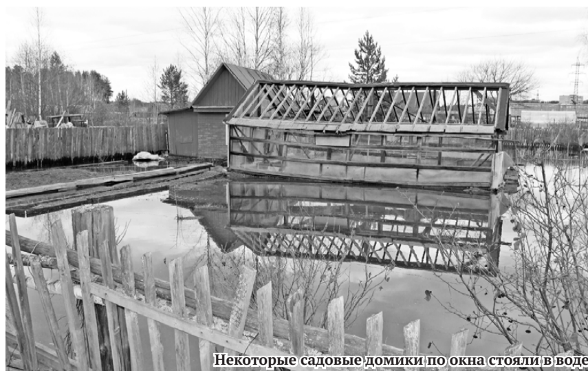
Некоторые садовые домики по окнам стояли в воде.

– Залив участков произошёл по причине двух порывов на водопроводе комбината, которые случились ещё зимой. Вода попала в пропускные трубы, промёрзшие по этой причине в период заморозков. В настоящее время специалисты комбината работают над устранением причин аварии, вода откачана, пропуск воды налажен посредством формирования новой траншеи.