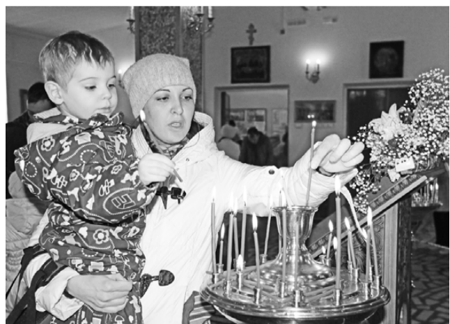
Свечи за здоровье вместе с родителями на Пасху ставили даже самые маленькие прихожане.

Земные поклоны и заупокойные молитвы на Светлой седмице отменяются. Православный мир ликует и славит Господа. Для посещения кладбища церковь назначает специальный день – Радоницу, и этот праздник совершается во вторник после Пасхальной недели, в этом году – 25 апреля.