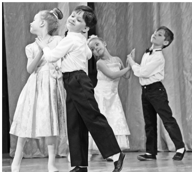
«Вальс Анастасии» в исполнении юных танцоров из детского сада «Уральская сказка».

Более двухсот участни- ков и около двадцати номеров: фестиваль год за годом поражает своим мас- штабом, степенью вовле- ченности детей, родителей и педагогов в творческий процесс. Свободных мест в зале не было. Например, детский сад «Семицветик» с номером «Казачата» вывел на сцену одну из групп це- ликом, причём это были не старшие ребята, а четырёх- и пятилетние малышки. То есть каждый ребёнок без исключения получил воз- можность проявить себя, улыбнуться аплодисментам, родителям с главной сцены города. А ведь это и есть главная педагогическая за- дача: раскрыть потенциал каждого подопечного, вне зависимости от темпера- мента, особенностей пове- дения, наличия врождённого таланта. Огромная работа наставников и семьи чита- лась за каждым натянутым носочком, счастливым, уве-