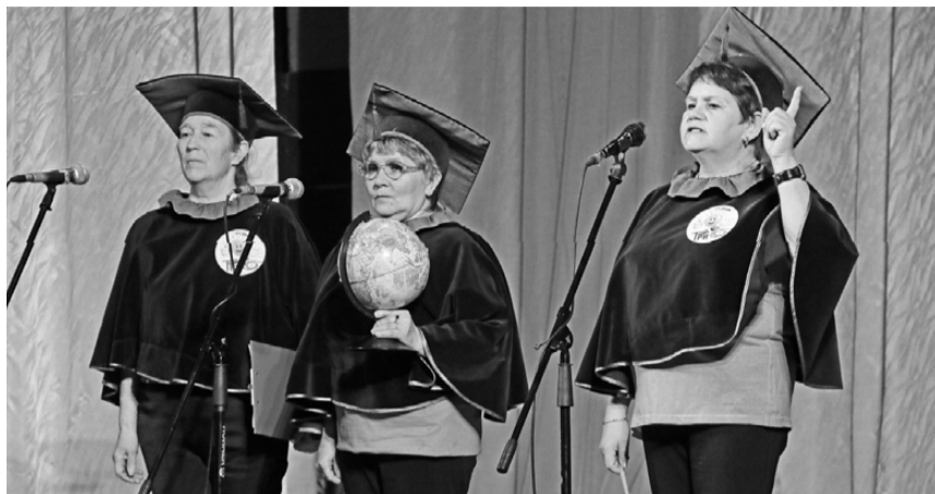
Команда ветеранов Управления образования, ОРСа и ОВД «ТриО»: «Лесной без нас никуда! И мы вместе с ним навсегда!»

без подготовки давали правильные ответы даже на самые каверзные вопросы, что совсем неудивительно – история Лесного вершилась на их глазах!