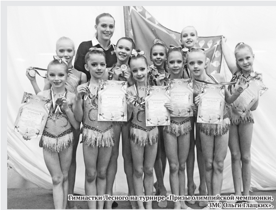
Гимнастки Лесного на турнире «Призы олимпийской чемпионки, ЗМС Ольги Глацких».