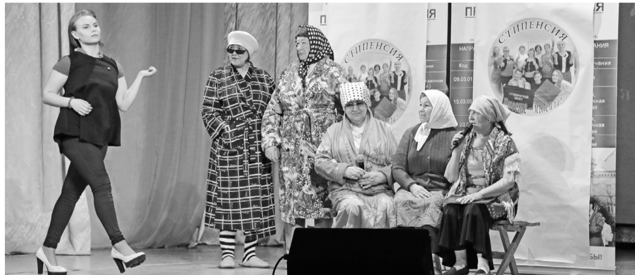
– Ой, гляди, какая ветреная! – обсуждали на лавочке, провожая взглядом молодую девушку, представители команды ЖЭКа № 2 и студентов МИФИ «Стипенсия» в конкурсе «Приветствие». А далее бабушек ждала «перезагрузка» в «Модном приговоре».

Итак, лучшей в номинации «Приветствие» стала команда представителей ЖЭКов № 1, № 7 и МЧС «Пенсионеры России». В интеллектуальном конкурсе победила сборная пенсионеров ЖЭКов № 3 и № 5 «Золотой запас». Самое интересное музыкальное задание – у команды ветеранов Управления образования, ОРСа и ОВД «ТриО», а в номинации «Самый чистый город» отличилась команда ЖЭКа № 2 и студентов МИФИ «Стипенсия». В финальном конкурсе – безоговорочная победа представителей ЖЭКа № 6, СУСа и медико-санитарной части «ЭхСтройМед» – её участники закончили правильно абсолютно все пословицы!