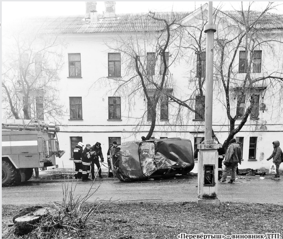
«Перевертыш» – виновник ДТП.

«Chevrolet Niva», двигаясь по улице Горького, не предоставил преимущество автомобилю «Kia cee'd», который спускался вниз по улице Бажова.