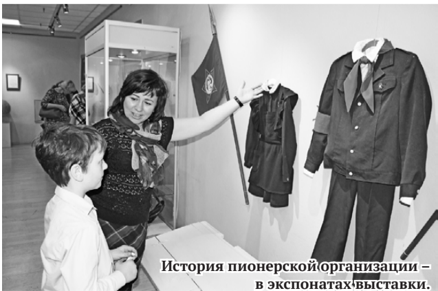
История пионерской организации – в экспонатах выставки.