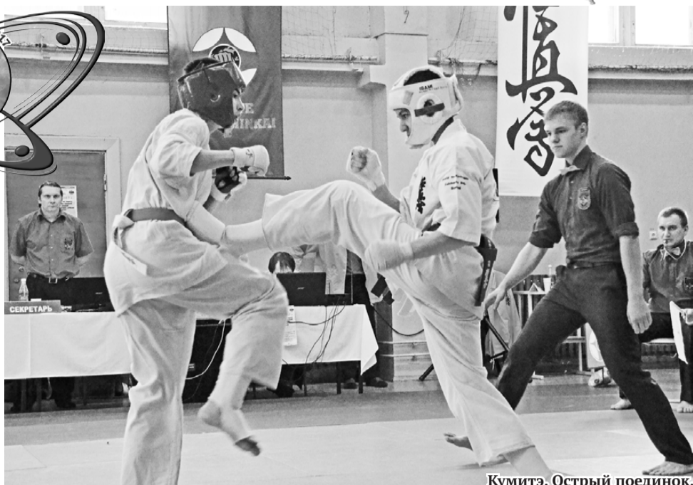
Кумитэ. Острый поединок.

16 апреля в ДЮСШ единоборств состоялся открытый городской турнир по карате Киокусинкай среди юношей и девушек 12-15 лет в рамках празднования 70-летнего юбилея Лесного.