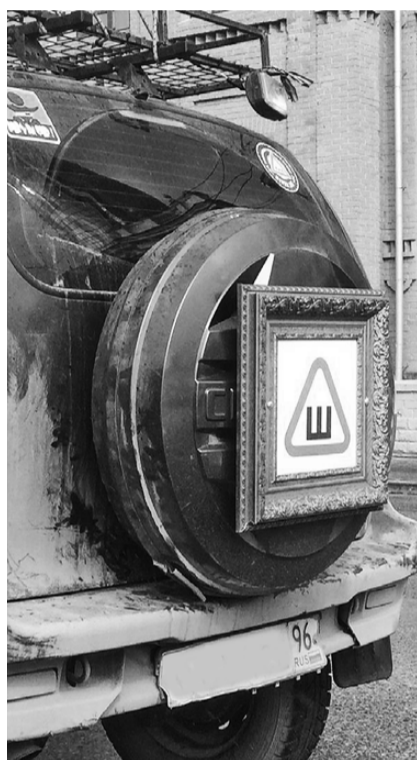
Картина Репина «ША». Золотая рама. Может себе позволить.

Ть есть к изменению требований ПДД можно было подготовиться заранее, а не в последний момент публично демонстрировать своё негодование, заклеивая половину своего автомобиля наклейками со знаком «Ш».