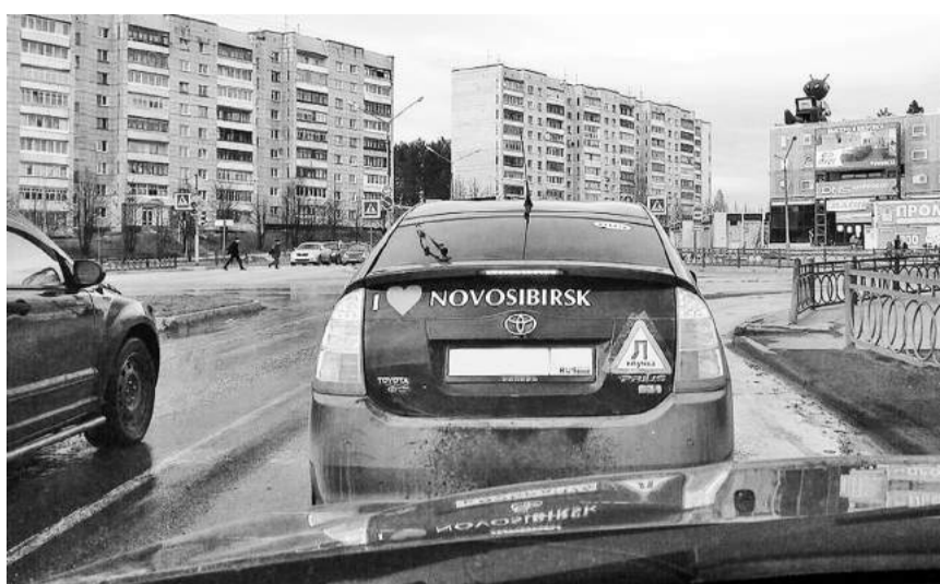
Ответственный водитель подготовился к будущим изменениям ПДД. Пока не по ГОСТу, зато все знают, что у него «липучка».

То ли юмор зашкалил, то ли водитель «психанул». Ещё в марте этого года автолюбителей предупреждали: с 4 апреля будут изменены Правила дорожного движения (Постановление Правительства № 333 от 24 марта 2017 года) – знак «Ш» необходимо прикрепить.