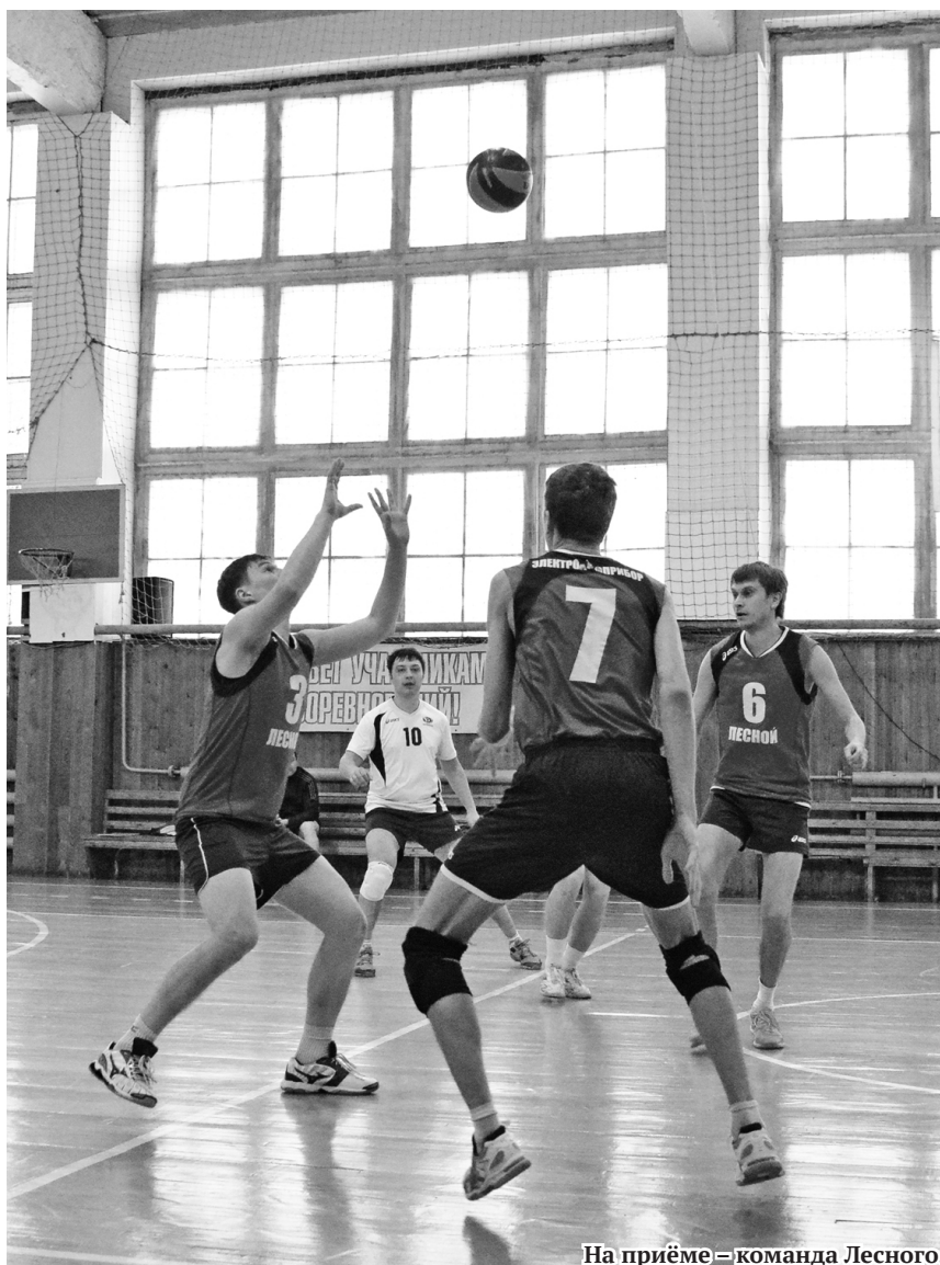
На приёме – команда Лесного.