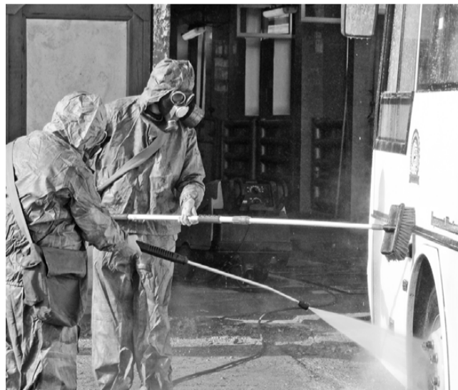
Тренировка по гражданской обороне. Лесной, 2012 год.

Информационно-аналитический отдел администрации ГО «Город Лесной».