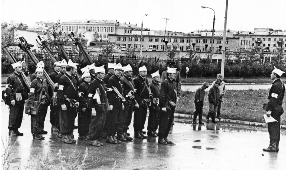
Соревнования санитарных дружин. Свердловск-45.