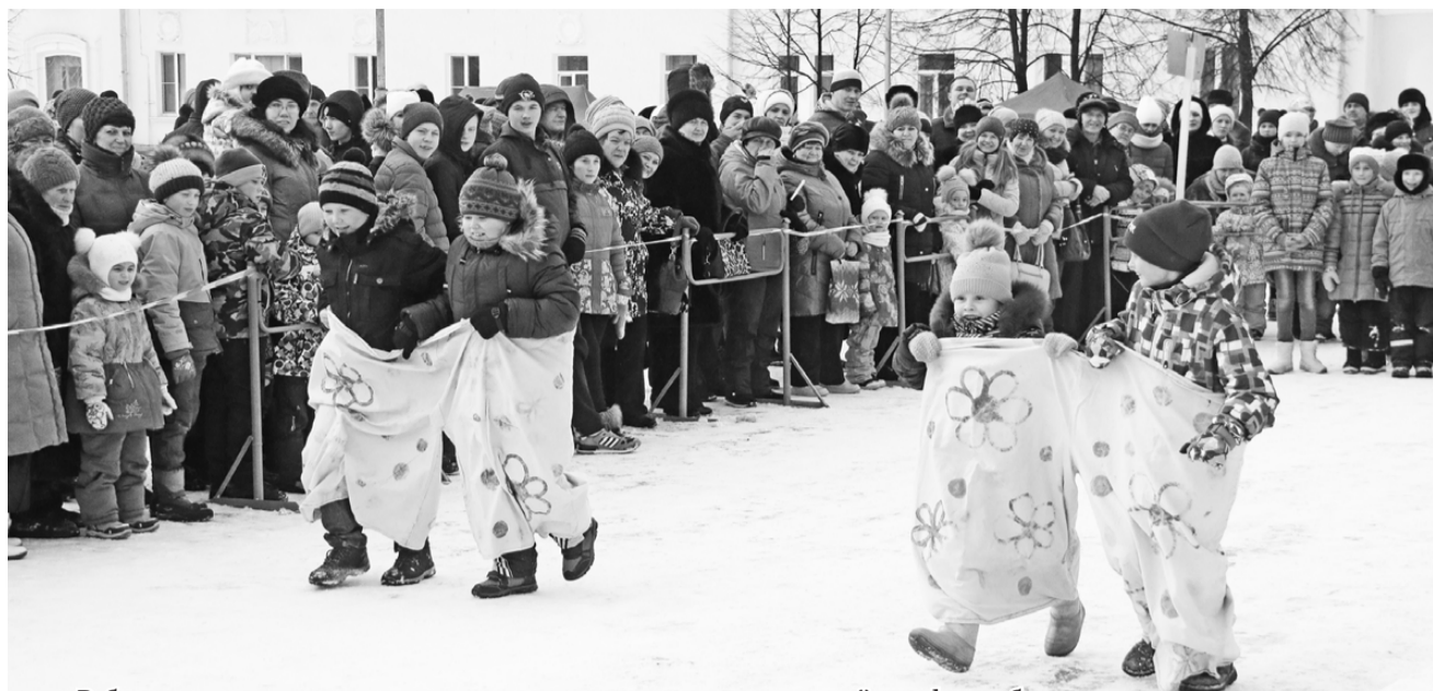
Ребята с удовольствием и азартом принимали участие в шуточной эстафете – беге в огромных широких штанах.