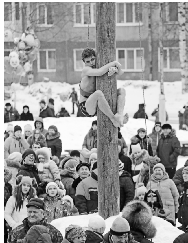
Смельчаки штурмовали «Потешный столб» как в одежде, так и без неё. Однако аттракцион покорился самым сильным, ловким и выносливым.

Что ж, чучело сгорело быстро, пламя было ярким и жарким. А, значит, не остаётся и доли сомнений – весна будет ранней!