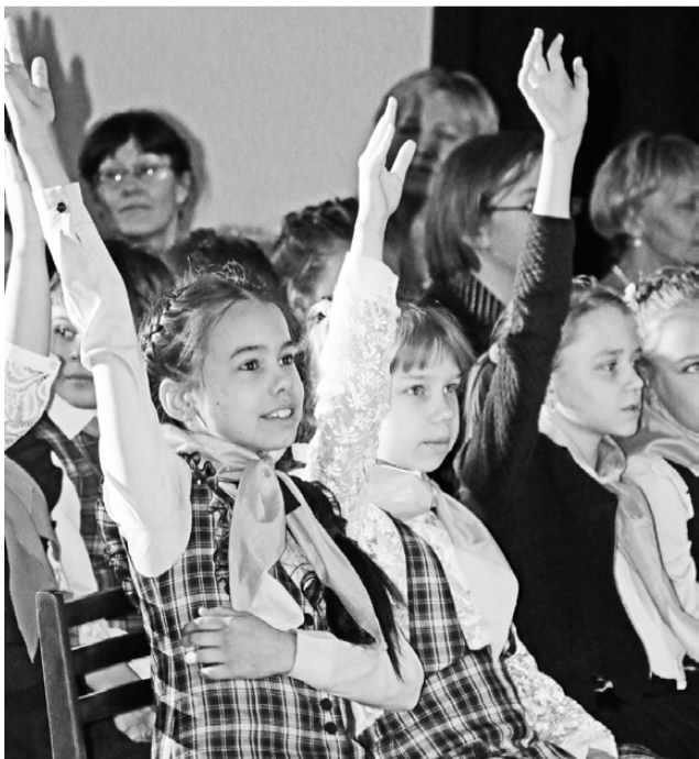
Третьеклассники школ Лесного стали пионерами нового объединения – Российского движения школьников.