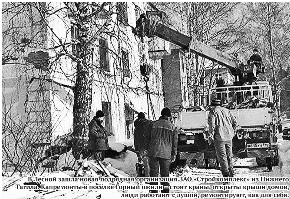
В Лесной зашла новая подрядная организация ЗАО «Стройкомплекс» из Нижнего Тагила. Капремонты в посёлке Горный ожили – стоят краны, открыты крыши домов, люди работают с душой, ремонтируют, как для себя.

КРОУСОВ. – Сейчас в Лесной зашли новые подрядные организации, которые на сегодняшний день начали активно работать.