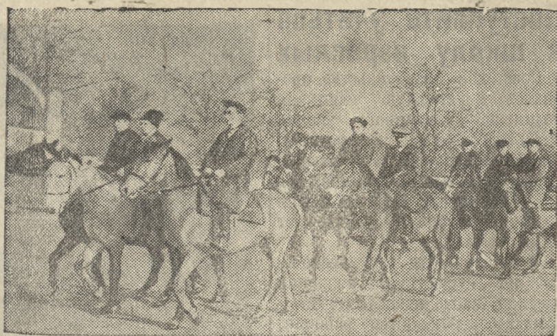
Ворошиловские всадники колхоза им. Чапаева (Золотоношский район, Полтавской области) на тренировке.

Сдан в эксплуатацию построенный колхозниками правобережный казелинский канал протяжением в 48 километров. 4 тысячи строителей закончили работы в 45 дней. Вынуто 1 миллион 100 тысяч кубометров грунта. Вода пошла на рисовые поля 26 колхозов, обслуживаемых Казалинской МТС (Казахская ССР). (ТАСС).