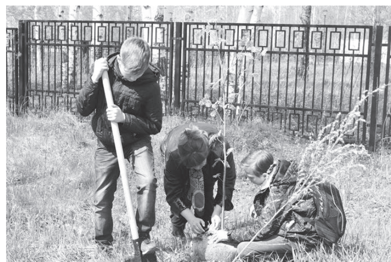
В будущем на этом месте вырастут рябины и липы