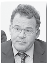
Первый вице-губернатор Владимир Тунгусов

За Алексеем Орловым будут закреплены промышленность, инвестиции, агропромышленный комплекс, наука, природный и ресурсный потенциал региона.