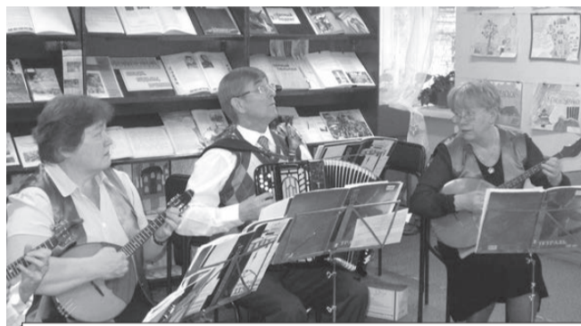
В центральной библиотеке любители живой музыки смогли насладиться концертной программой «Стань артистом!», подготовленной творческими коллективами ДШИ