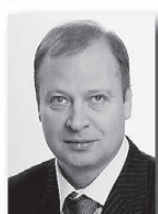
Виктор Шептий, вице-спикер областного парламента:

«Партпроект «Открытая власть – электронный муниципалитет» нацелен на продвижение механизма получения государственных и муниципальных услуг через многофункциональные центры. Поэтому важна организация обратной связи с жителями региона, с общественностью. Мы хотим знать, что необходимо сделать для повышения качества оказания услуг в МФЦ».