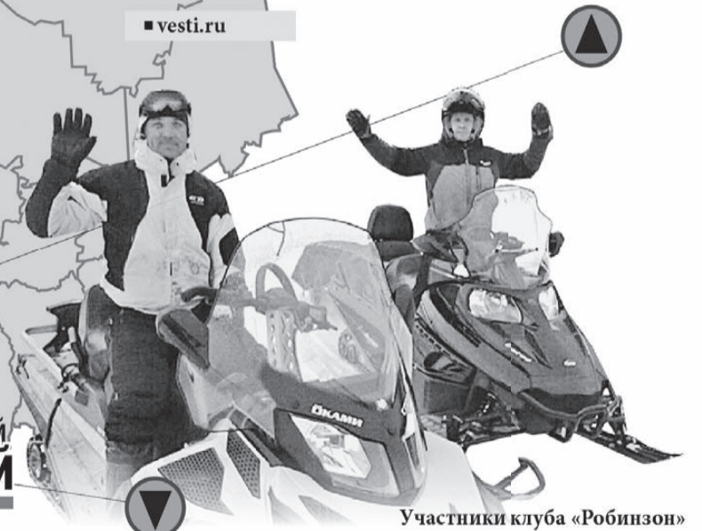
Участники клуба «Робинзон»