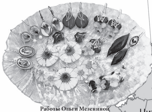
Работы Ольги Мезениной