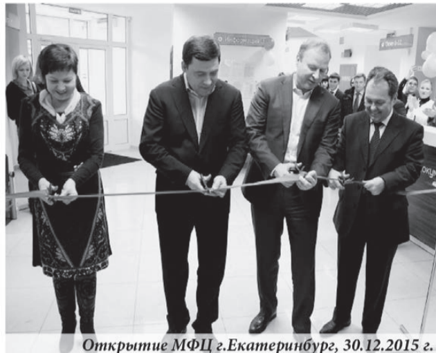
Открытие МФЦ г.Екатеринбург, 30.12.2015 г.