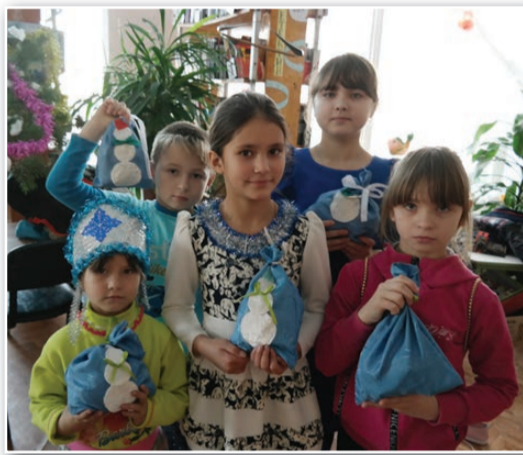
Каждый ребенок получил по мешочку с подарками

Отшумели, отгремели фейерверками и салютами праздники у новогодних елок, которых так долго ждали. Наши активисты решили следовать традициям: привезли из лесу елку, украсили шарами и гирляндами, подготовили сказочное представление и, конечно, пригласили 6 января всех поселковых ребятшек в библиотеку на праздник. С первых минут дети окунулись в сказочный мир.