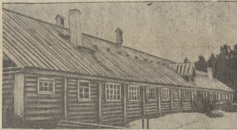
Вновь выстроенный стандартный свиварник на 40 стоек в колхозе им. 8-го марта, Режевского района.

Инж. землеустроитель Свердловского ОБЛЗО с. Клевакино.