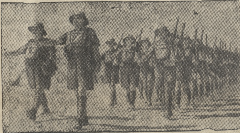
Английские войска на фронте в Западной пустыне (Африка).

В Восточной Африке основные операции попрежнему развертываются в секторе Дессе (к северо-востоку от Аддис-Абебы). (ТАСС).