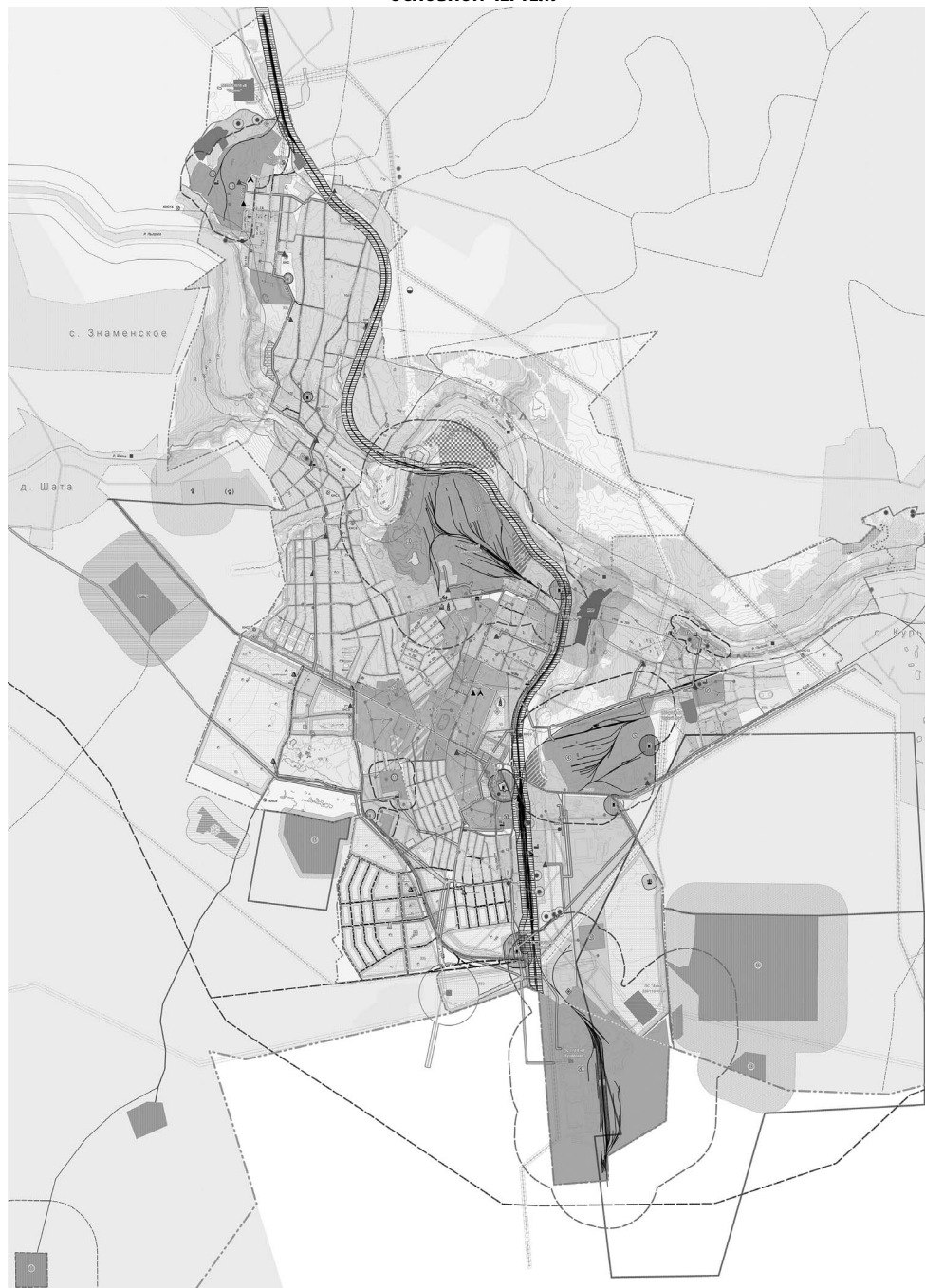
Схема расположения санитарно-защитной зоны АО «Сухоложское литье» 1000 м (фрагмент г. Сухой Лог)