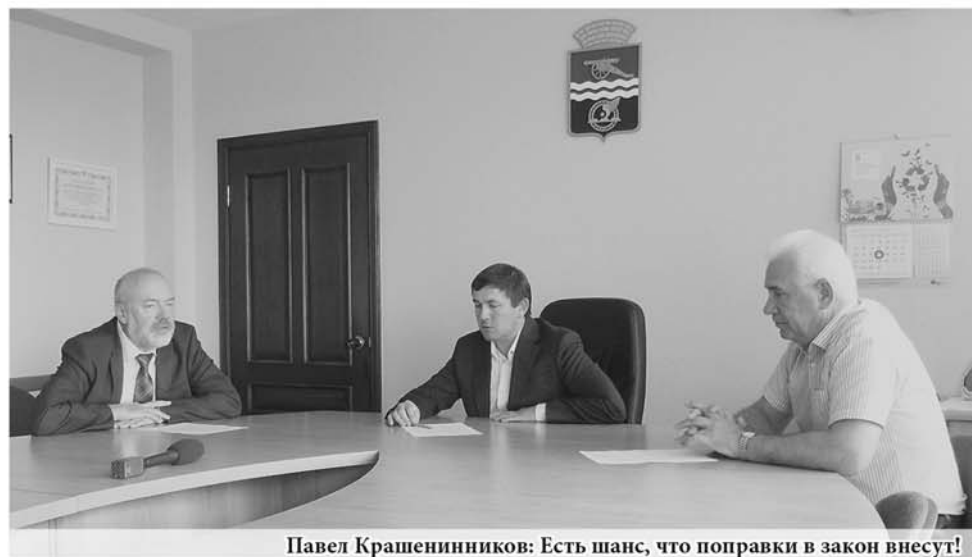
Павел Крашенинников: Есть шанс, что поправки в закон внесут!