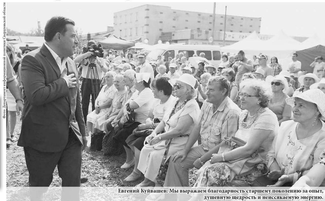
Евгений Куйвашев: Мы выражаем благодарность старшему поколению за опыт, душевную щедрость и неиссякаемую энергию.

«Быть нужным и полезным обществу возможно в любом возрасте – вот главный посыл Дня пенсионера, перекликающийся с нашей программой «Пятилетка развития». Центральное место в ней занимает человеческий потенциал, качество жизни уральцев, которое мы должны повышать, выводя Свердловскую область в тройку регионов-лидеров».