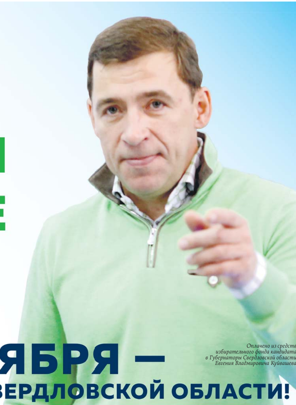
Оплачено из средств избирательного фонда кандидата в Губернаторы Свердловской области Евгения Владимировича Куйвашева

10 СЕНТЯБРЯ – ВЫБОРЫ ГУБЕРНАТОРА СВЕРДЛОВСКОЙ ОБЛАСТИ!