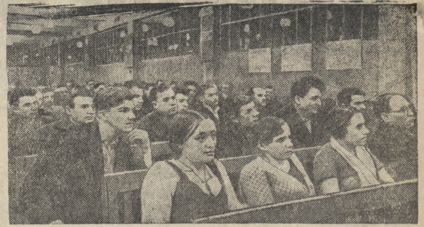
Отчетно-выборное собрание в литейном цехе № 3 завода имени Сталина (Москва).