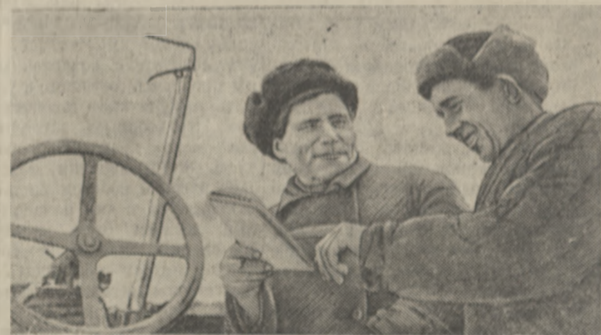
Колхоз «Красная звезда», Турпеского района, полностью готов к весенним полевым работам.

Достижения тружеников колхозной деревни бесспорны. Но останавливаться на достигнутом нельзя, надо еще настойчивее двигаться вперед, укрепляя артельное хозяйство, борясь за дальнейшее укрепление трудовой дисциплины. Перед колхозами стоит задача — в 1941 году с еще большим успехом продол-