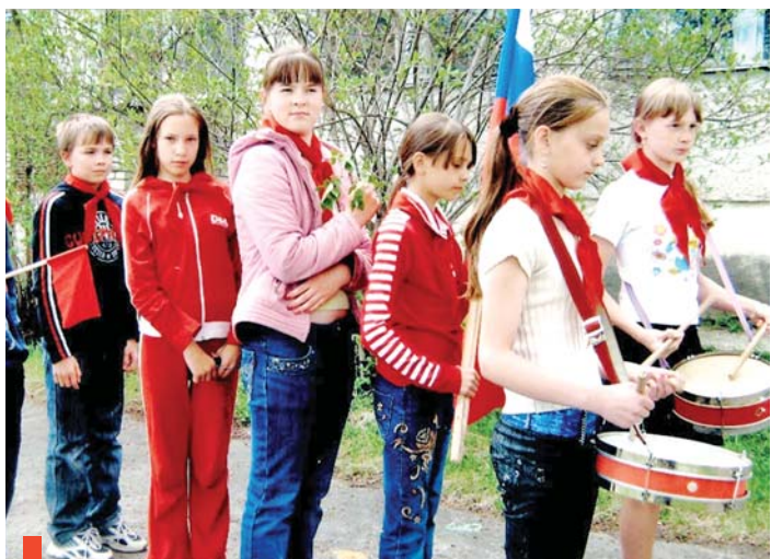
Алтынайские пионеры в День пионерии, 2000-е гг.