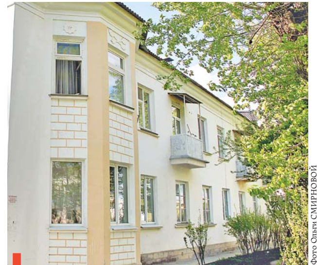
Стилизованная рустовка и эркер дома №12 по ул. Победы

Но обо всем подробнее. Облицовка внешних стен зданий или их частей четырёхугольными и, как правило, плотно пригнанными друг к другу камнями называется рустовкой (от лат. rusticus «простой, грубый»). На улице Победы рустованная отделка встречается на фасадах домов №1, 6, 8, 9. Рустовка украшает преимущественно углы зданий. Двигаясь по четной стороне улицы дальше, видим на домах №12, 14 и 16 имитацию рустовки – прорисованную по штукатурке разбивку стен на прямоугольники. Рустованная отделка выполняет не только декоративную функцию – она создает впечатление массивности здания.