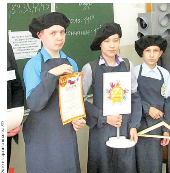
Победители из школы №4

Девушки представили свои визитные карточки, ответили на вопросы теста об овощах, приготовили из набора продуктов холодные блюда и оформили их подачу на стол. Капитанам команд было предложено сложить за пять минут разными способами салфетки для сервировки стола. В задании «Экономная хозяйка» участницы чистили картофель и рассчитывали процент отходов в зависимости от сезона. На творческом этапе пели «картофельные» песни и частушки, ставили сценки, посвященные второму хлебу.