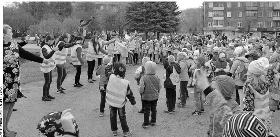
Танец под песню «Соблюдай ПДД и дружи с ГИБДД»

Сухой Лог присоединился к акции, проведя танцевальный флешмоб, в котором приняли участие более 500 детей и взрослых из 16 образовательных учреждений. По дороге к Центральной площади города – месту проведения акции – дети раздавали памятки-листовки водителям и пешеходам.