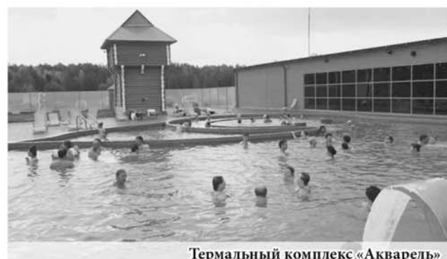
Термальный комплекс «Акварель»

В городе существует ещё одна точка притяжения для гостей региона – термальный комплекс «Акварель». Евгений Куйвашев некоторое время назад посетил эти источники и отметил, что они имеют все шансы, чтобы стать важным звеном в развитии туристического потенциала Свердловской области.