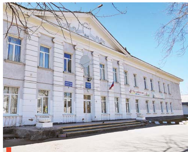
Рустованные пилястры. Школа №2

В архитектуре конца 40-х – начала 50-х господствовал сталинский ампи́р – стиль, утвердившийся с момента создания Союза архитекторов в 1932 году и сочетавший монументальный дух и роскошь. Среди отличительных черт этого стиля выделяют предпочтение ансамблевой застройке улиц и декоративизм. Посредством декоративных элементов советские зодчие послевоенного времени отражали в архитектуре триумфальную победу над фашизмом.