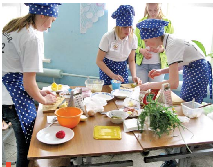
Команда школы №2 готовит блюда из картофеля

«Ее величество картошка» – под таким названием на базе столовой школы №7 прошел муниципальный конкурс юных кулинаров – учеников 6-7 классов. В состязаниях участвовали команды из школ №2, 7, лицея, школ сел Курьи, Знаменское, Рудянское, Новопышминское, поселка Алтынай.