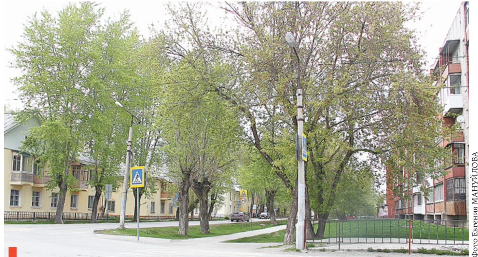
На перекрестке Победы и Кирова

Несмотря на то, что одинаковых зданий на улице крайне мало и многие дома и учреждения уникальны по внешнему виду, все вместе они создают определенный художественный облик улицы. Налицо ансамблевая застройка Победы. К декоративным элементам сталинского ампира можно с полным правом отнести необычную облицовку зданий, выступы в стенах в виде полуколонн и лепнину на фасадах.