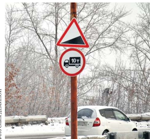
Новое место установки знака «проезд запрещен» по ул. Уральской и замененный знак на путепроводе