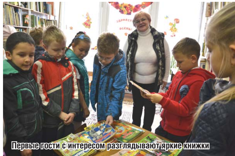
Первые гости с интересом разглядывают яркие книжки