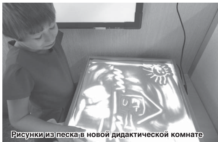
Рисунки из песка в новой дидактической комнате

Так, фонд приобрел диван-книжку и четыре кресла. Прочная и удобная мебель с