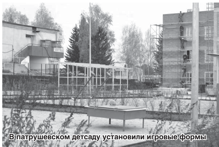
В патрушевском детсаду установили игровые формы

строительство детского сада началось позже всех. По большому счету, работы начались только в июне, когда на трех остальных объектах был готов фундамент, а в Октябрьском и вовсе – возведен первый этаж. Но строители