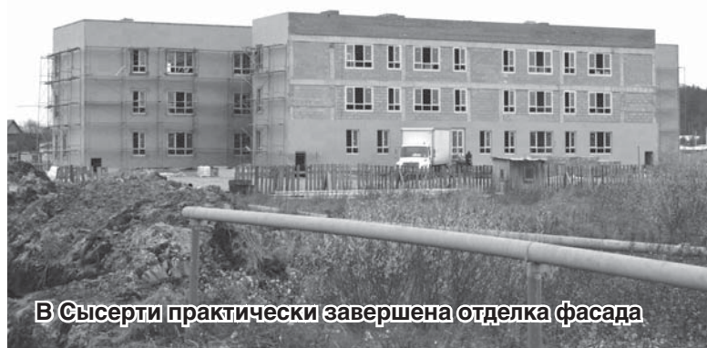
В Сысерти практически завершена отделка фасада