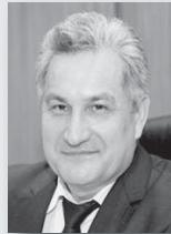
Юрий Биктуганов, министр образования Свердловской области:

«Региональные власти и уральцы высоко ценят политику социального ответственного бизнеса, когда компании и предприятия не только создают рабочие места, обеспечивают выпуск современной продукции и отчисления в бюджеты всех уровней, но и активно участвуют в социальных проектах, программах государственно-частного партнерства, поддерживают образовательные, культурные и спортивные учреждения, помогают муниципальным образованияам, на территории которых они расположены».