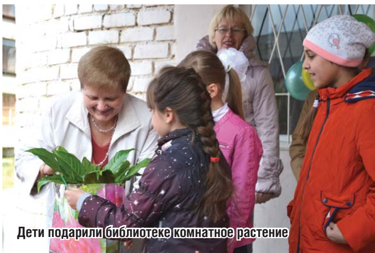
Дети подарили библиотеке комнатное растение