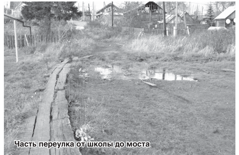
Часть переулка от школы до моста

Асфальт на переулке Школьном вообще развалился! Ходить невозможно. Инвалиды, старики, дети – все ноги ломают. Ни в амбулаторию не пройти нормально, ни к реке. Глава говорит, что денег нет. А нам-то что делать?