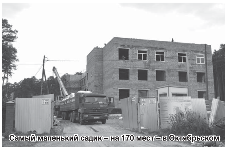
Самый маленький садик – на 170 мест – в Октябрьском