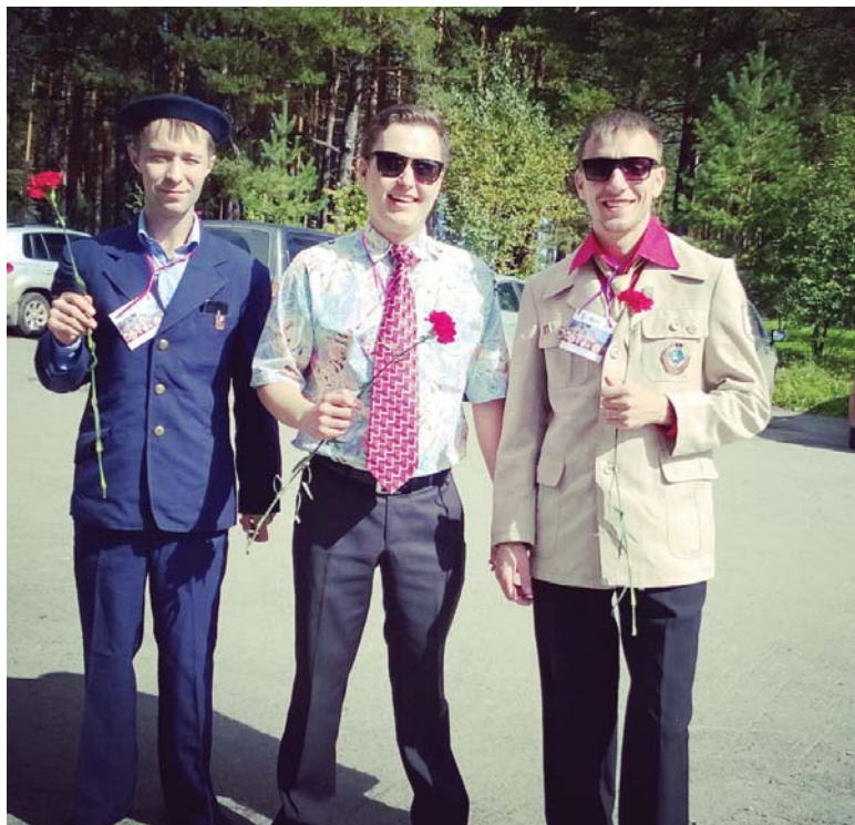
Не обошлось и без подарков. По итогам двух дней определили

В процессе подготовки к фестивалю каждая команда получила творческое задание. Представить себя им нужно было, рассказав о жизни молодежи одного из десятилетий 20 века. Так, команда сотрудников завода Уралгидромаш представляла молодежь 70-х годов, а сотрудники Сысертской ЦРБ – 1930-х. Костюмы, атрибутика, шутки – к своим выступлениям участники подготовились очень серьезно.