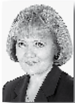
Людмила Бабушкина, председатель Законодательного Собрания Свердловской области:

Завершилась весенняя сессия областного парламента, в заседаниях объявлен перерыв. Депутаты выполнили намеченные задачи по законодательной поддержке «майских указов» Президента РФ и других стратегических документов, определяющих стратегию развития России и Свердловской области.