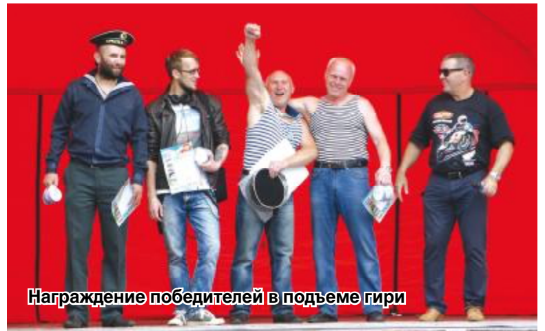
Награждение победителей в подъеме гири