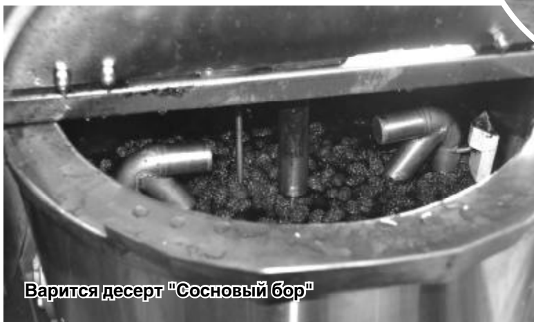
Варится десерт «Сосновый бор»