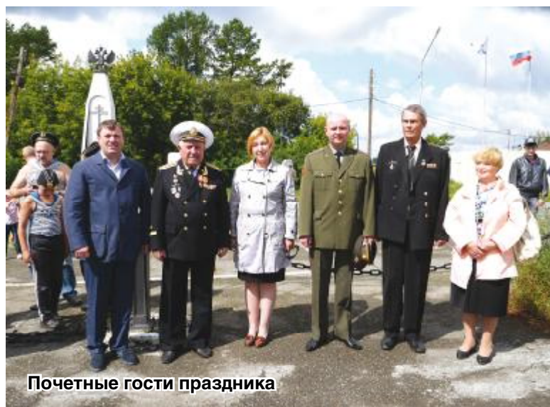
Почетные гости праздника