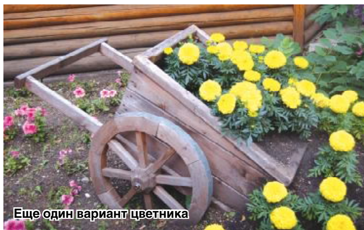
Еще один вариант цветника