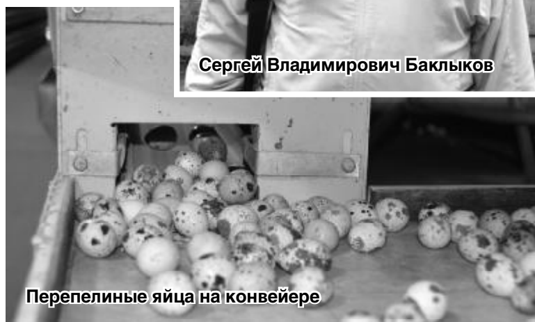
Перепелиные яйца на конвейере