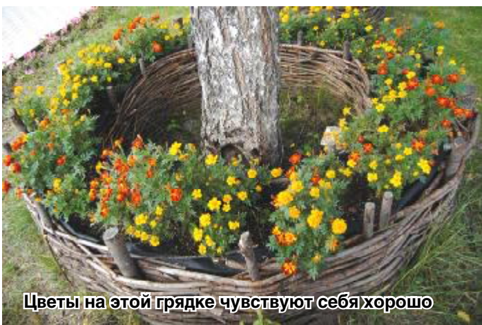
Цветы на этой грядке чувствуют себя хорошо

Если почва на участке сырая и вы боитесь, что весной из-за таяния снега у плодовых деревьев будут скапливаться излишки влаги, под данные грядки можно положить обрезки трубы под небольшим наклоном, чтобы влага эта уходила. Попробуйте! Каждый садовод – это в какой-то степени и дизайнер.