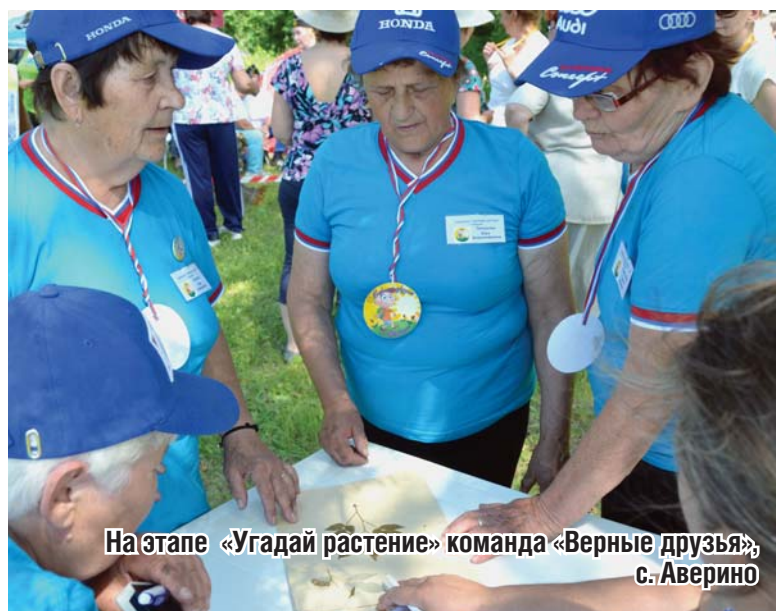
На этапе «Угадай растение» команда «Верные друзья», с. Аверино