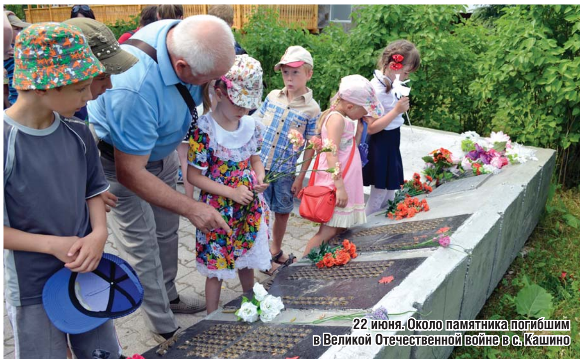
22 июня. Около памятника погибшим в Великой Отечественной войне в с. Кашино