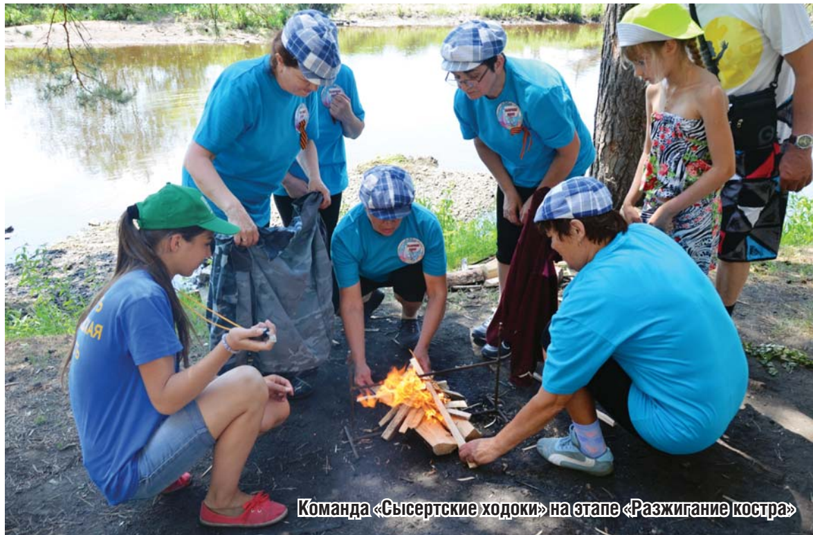
Команда «Сысертские ходоки» на этапе «Разжигание костра»