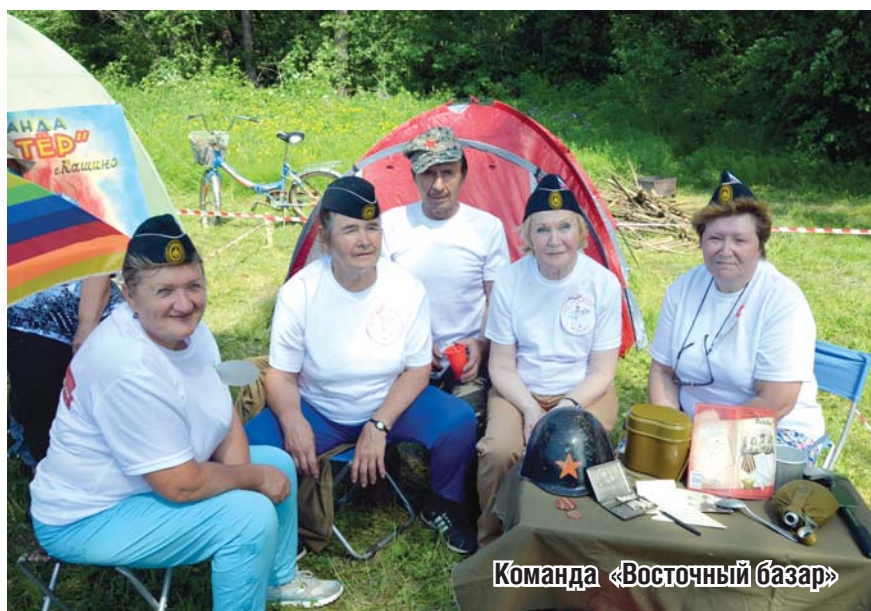
Команда «Восточный базар»

турслете заняла команда «Сысертские ходоки». Победителями они становятся уже второй год подряд.