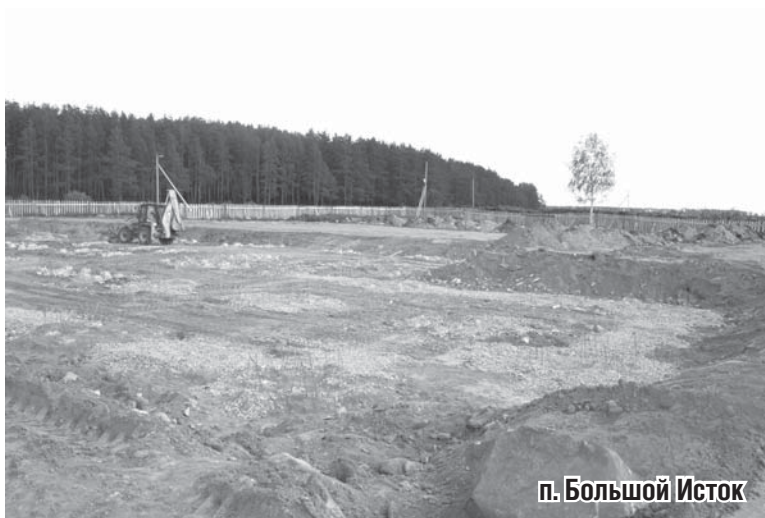
п. Большой Исток