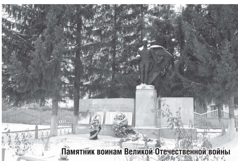
Памятник воинам Великой Отечественной войны