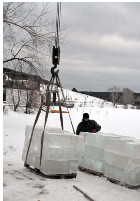
На Сысертском пруду заготавливают ледяные кубы для ограждения праздничного городка

Наталья Беляева.