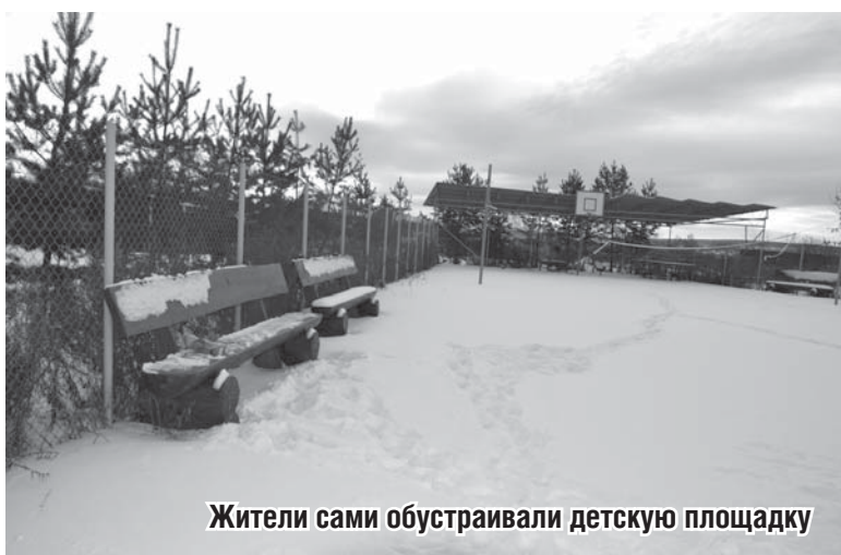
Жители сами обустроили детскую площадку

Потребность в застройке высока. Соседнее с Бобровским Косулино Белоярского района уже застроено. Арамилль тоже активно застраивается. Что неудивительно: цена на участки приемлемая и близость к областному центру.