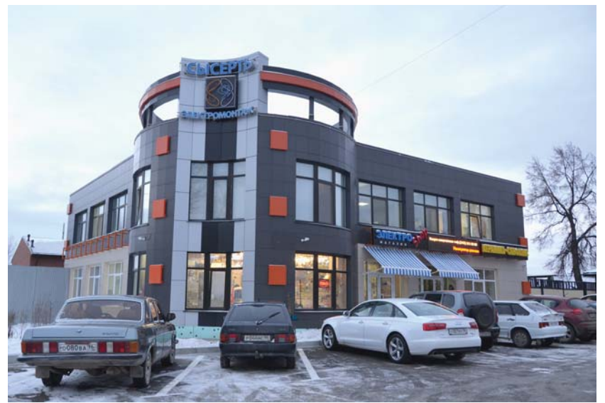
Новый офис ООО «Сысерть-Электромонтаж» с фирменным магазином электротоваров на первом этаже

Если посмотреть на географию, которую мы охватываем, то помимо нашего района, это и Белоярский, Дегтярский, Полевской, Первоуральский, Березовский, Ревдинский, Красноуфимский районы, Екатеринбург. Также на нашем оперативно-техническом обслуживании множество подстанций.