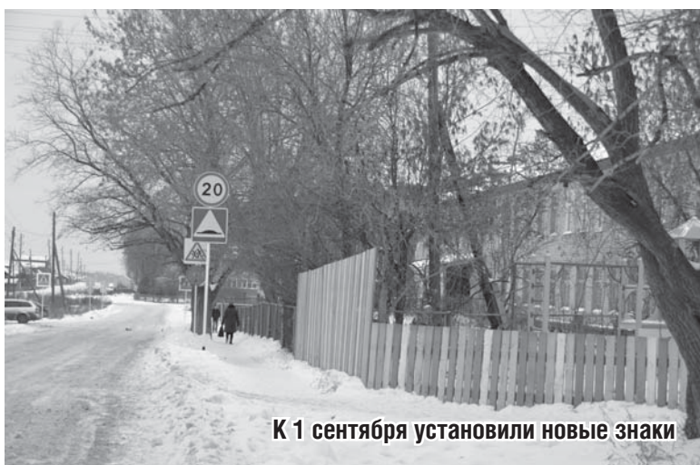
К 1 сентября установили новые знаки