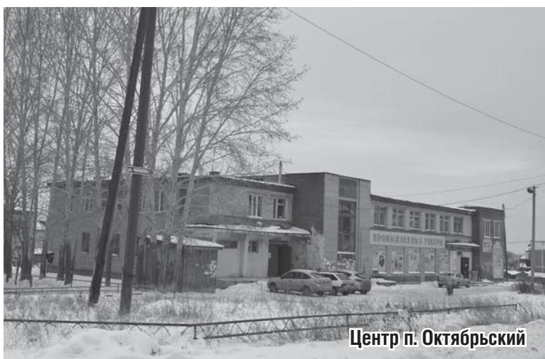
Центр п. Октябрьский

лыжах, занимаются велоспортом, карате, хореографией. Тренажерный зал посещают. Самой старшей спортсменке, которая ходит в группу здоровья, 73 года.