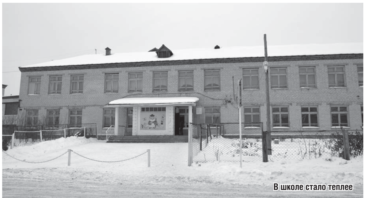
В школе стало теплее