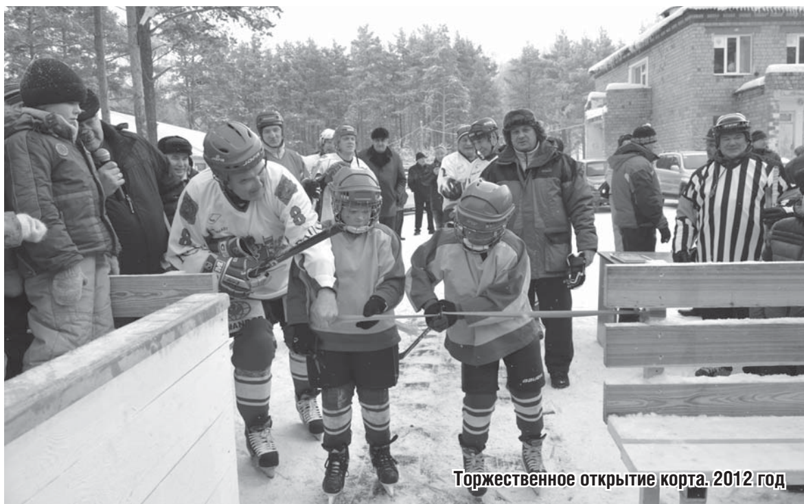
Торжественное открытие корта. 2012 год