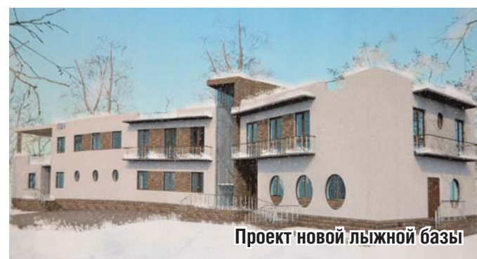
Проект новой лыжной базы