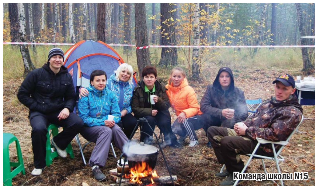
Команда школы №15