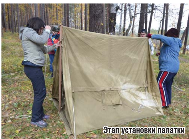
Этап установки палатки