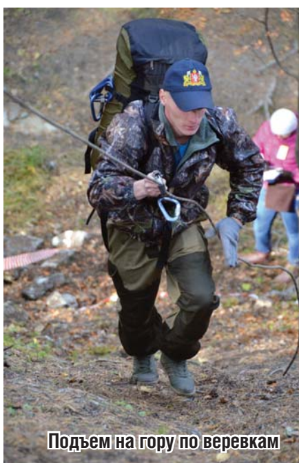
Подъем на гору по веревкам

побольше практических заданий, которые в реальной жизни гораздо нужнее.