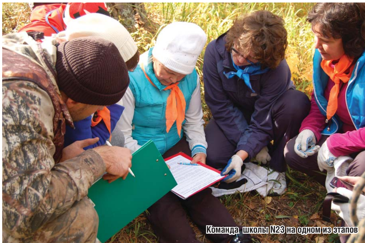
Команда школы №23 на одном из этапов