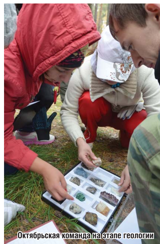
Октябрьская команда на этапе геологии