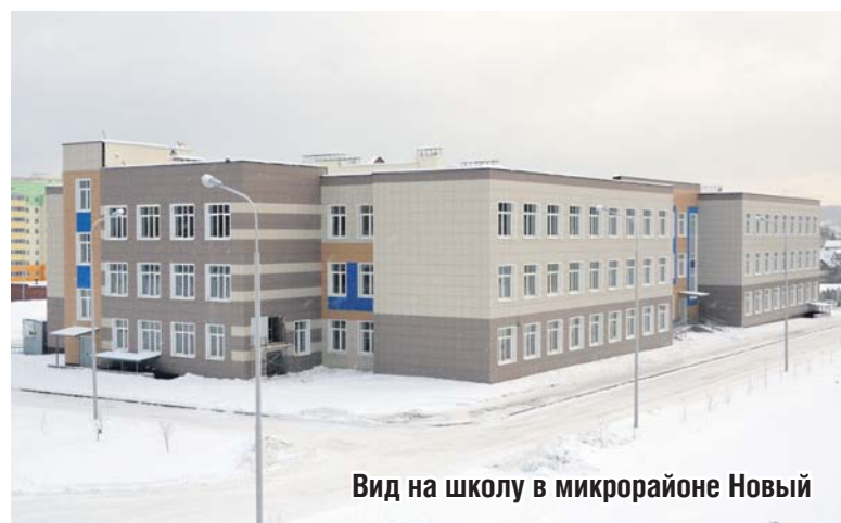
Вид на школу в микрорайоне Новый

– Школа построена по новым требованиям, она просторная. Здание рассчитано на 480 мест. Знаю, что подобные школы в Екатеринбурге принимают тысячу-тысячу сто учеников. Поэтому