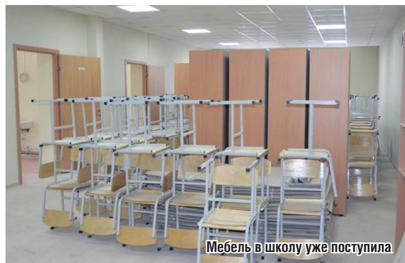
Мебель в школу уже поступила