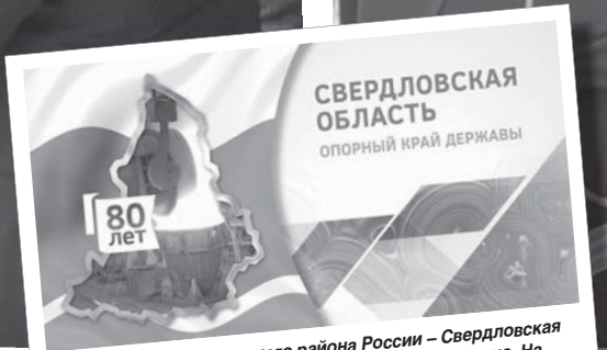
Центр старопромышленного района России – Свердловская область – отметила 17 января 2014 года своё 80-летие. На торжественное собрание в Екатеринбург съехались более 2000 гостей из городов Среднего Урала и других регионов. Выставка, добрые слова официальных лиц о нашем крае и его людях, концерт именитых уральских коллективов, подарки... Это событие стало точкой отсчёта для новых свершений Свердловской области.