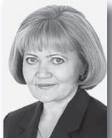
Людмила Бабушкина, председатель Закобрания Свердловской области:

В течение всего дня на открытых площадках проходили мастер-классы, пешеходные экскурсии по городу, концерты джазовых звёзд Урала и России, зарубежных музыкантов.