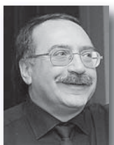
Даниил Крамер, народный артист России:

– В Год культуры в Свердловской области проходит множество знаковых мероприятий. Это и музыкальный фестиваль имени Чайковского в Алапаевске, и музыкальные вечера в дни Ирбитской ярмарки. Фестиваль «URALTERRAJAZZ» повышает привлекательность города Камышлова.