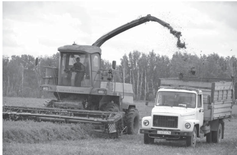
Последний день убирают люцерну. Отличная выросла. Заканчивают второй укос и скоро третий начинать можно, очень рентабельная культура.

Первое полугодие 2014-го хозяйство закончило с прибылью в четыре млн 204 тысячи рублей. После небольшого повышения закупочных цен в ноябре 2013 года стало рентабельным молоко, хотя цены на него до сих пор