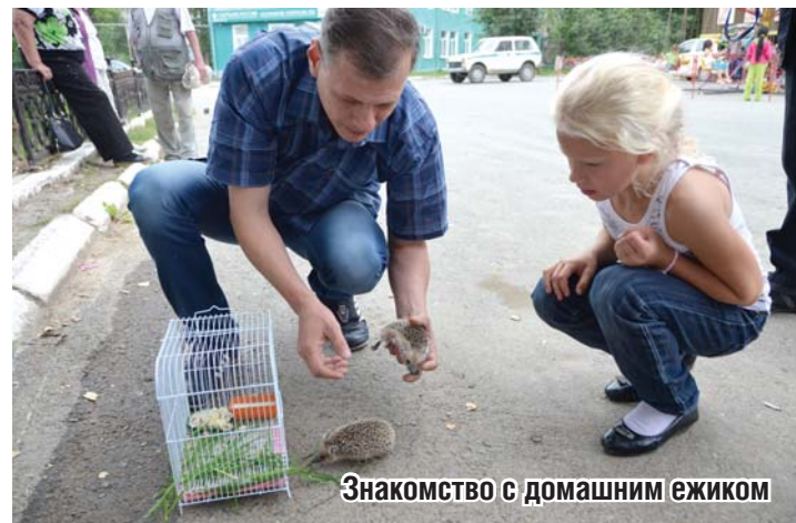
Знакомство с домашним ежиком