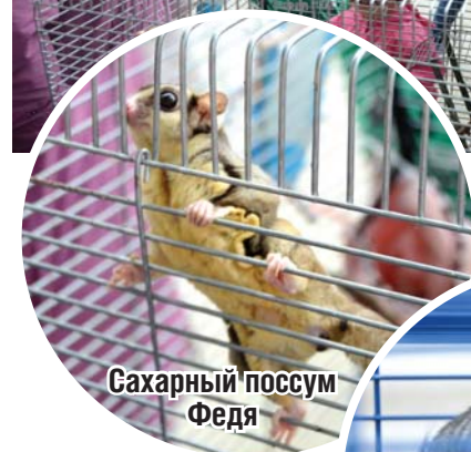
Сахарный поссум Федя