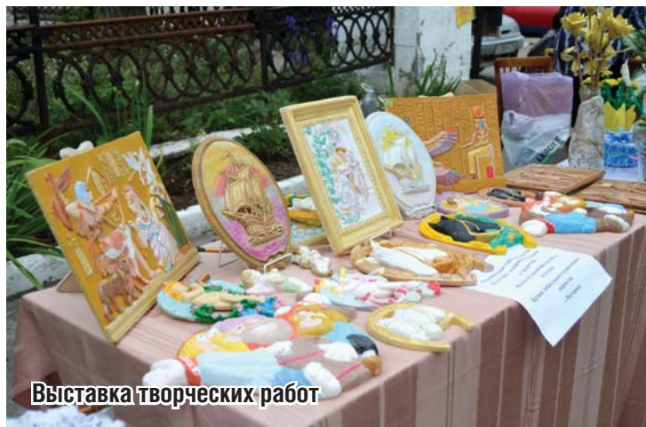
Выставка творческих работ